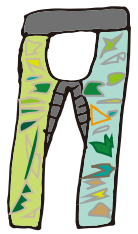
カモフライエロー