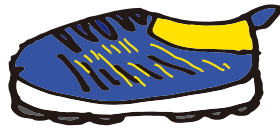
ネイビー×イエロー