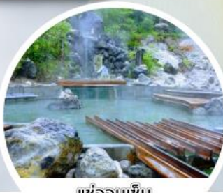
แช่ออนเซ็น