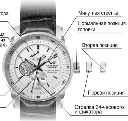
Рис. 6 ЧАСЫ С МЕХАНИЗМОМ YN84