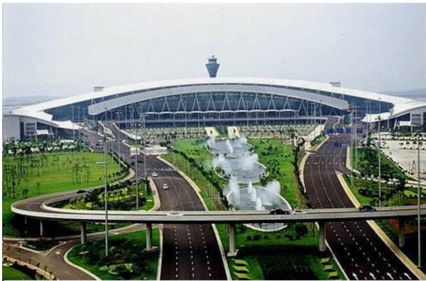
COULOIR DU TERMINAL 1 (TERMINAL 1 CORRIDOR)