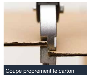
Coupe proprement le carton