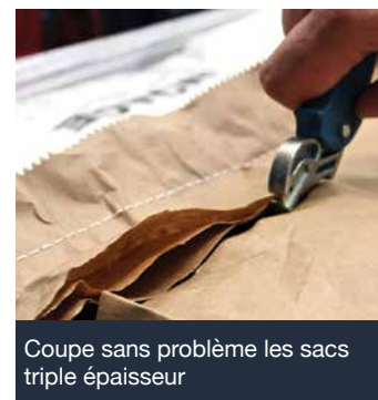
Coupe sans problème les sacs triple épaisseur