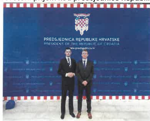
Slika 7. svečani prijem kod predsjednice Republike