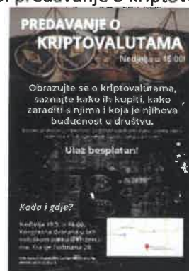
Slika 6. predavanje o kriptovalutama