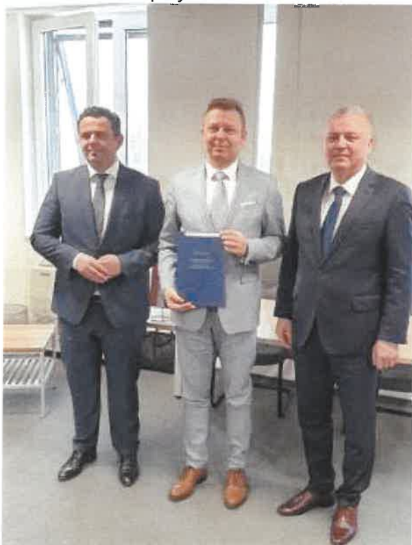
Slika 24. dodjela odluke o sufinanciranju novog projekta KPC-a