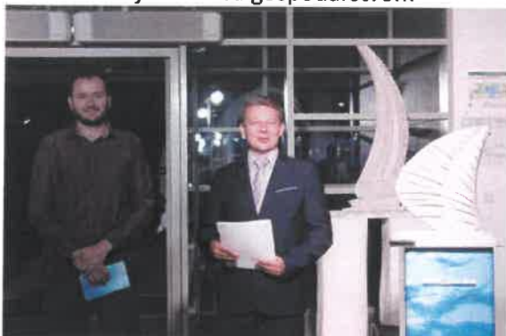
Slika 14. Svečani potpisa Ugovora sa FOI Varaždin