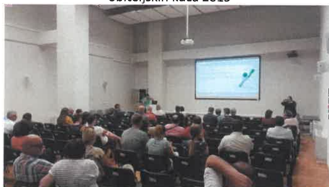
Slika 9. prezentacije projekta energetske obnove obiteljskih kuća 2019