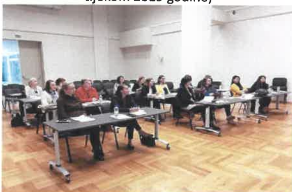
Slika 5. seminar javne nabave (konstantno tijekom 2019 godine)