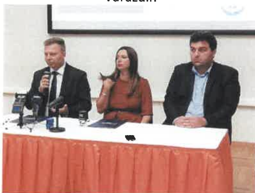
Slika 16. tjedan poduzetništva u RCTP-u (predstavnici HBOR i HAMAG-BICRO)