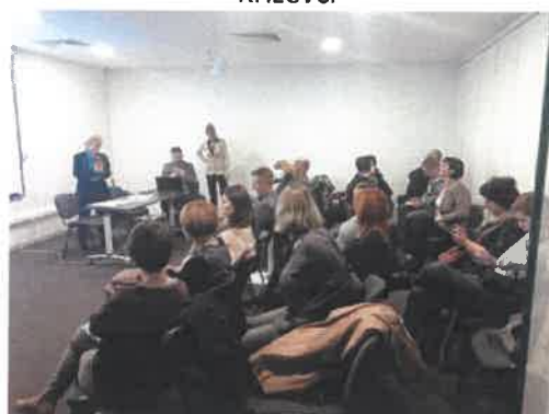
Slika 23. radionica za novi programski dokument prekogranične suradnje Hrvatska – Mađarska