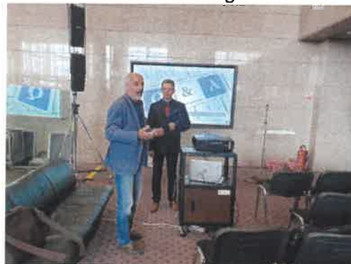
Slika 19. posjet studijske grupe u sklopu kolegija poduzetništvo