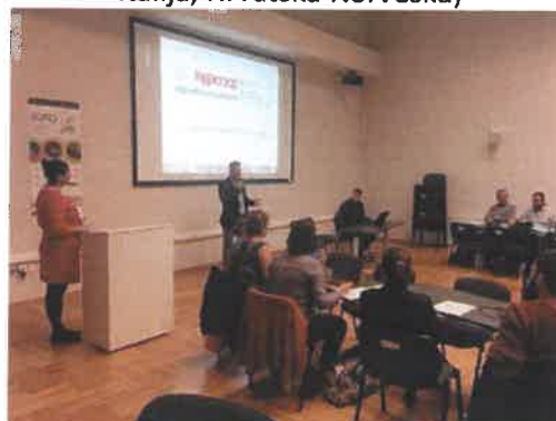
Slika 15. dolazak WBAF u RCTP (World Business Angels Investment Forum Croatia)