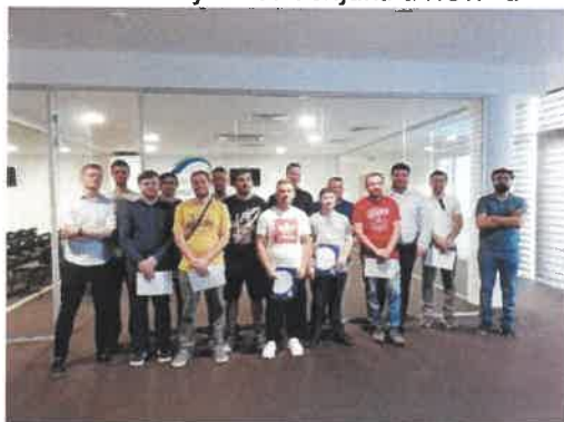
Slika 8. završetak prvog ciklusa stručnog obrazovanja IT stručnjaka u RCTP-u