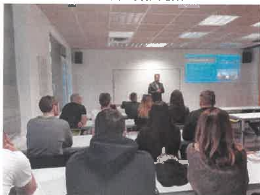
Slika 6. predavanje budućim poduzetnicima na Veleučilištu Vern