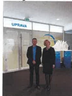
Slika 17. Predavanje na međunarodnoj izložbi inovacija ARCA u NSK Zagreb