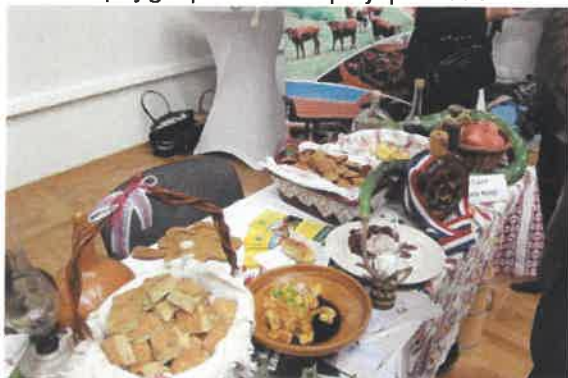
Slika 22. prezentacija tri natječaja EU fondova za poljoprivredu iz mjera 4.1