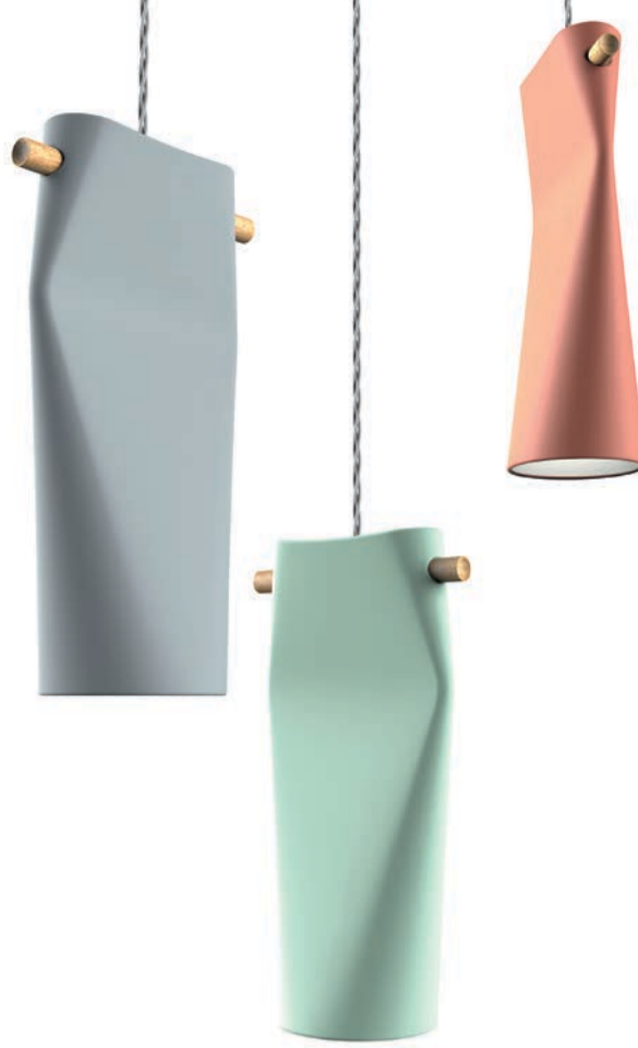
Eine eingedrückte, deformierte Röhre ist charakteristisch für die „Dent“-Leuchte (Design: Skrivo) von Miniforms. Erstmals setzt das italienische Unternehmen hier keramisches Material ein, das die Leuchte besonders grazil erscheinen lässt. A dented, deformed pipe is characteristic of the “Dent” lamp (design: Skrivo) by Miniforms. For the first time, the Italian company has used a ceramic material that makes the lamp look especially graceful.