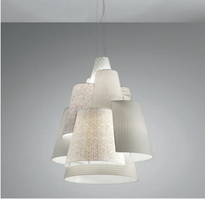
Die Hänge- und Wandleuchten-Kollektion „Melting Pot“ von Sandro Santantonio für Axo Light ist ein zeitgenössischer Turm von Babel, bei dem unterschiedliche Formen und Muster harmonisch miteinander kommunizieren. Daraus ergibt sich eine ausdrucksstarke architektonische Konstruktion, in der gegensätzliche Charaktere und Stile miteinander verschmelzen. The “Melting Pot” pendant and wall lamp collection by Sandro Santantonio for Axo Light is a contemporary Tower of Babel, in which different forms and patterns communicate harmoniously with each other. That results in an expressive architectural construction, in which contrasting characters and styles merge.