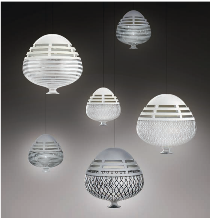
Bei der Kollektion „Invero“ von Arik Levy für Artemide trifft Muranoglas auf Aluminium, Glasbläserkunst auf Druckguss und die Liebe zum Handwerk auf den Wunsch nach Innovation. Mit einer LED ausgestattet, spendet „Invero“ eine neuartige, angenehme High-Contrast-Beleuchtung. In the “Invero” collection by Arik Levy for Artemide, Murano glass comes together with aluminium, the art of glass blowing with die casting, and the love of hand craftsmanship with the desire for innovation. Equipped with LED, “Invero” provides a new kind of pleasant high-contrast lighting.