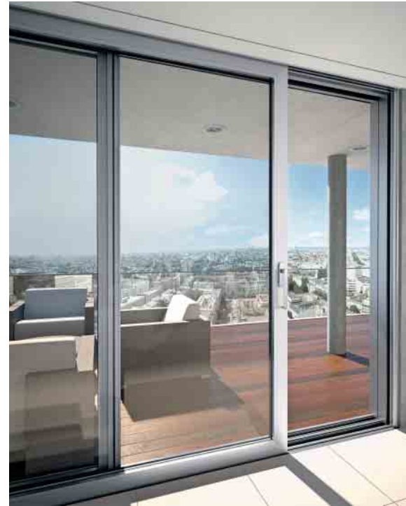
Schüco ASS 70 – hochwärmegeädmmtes Hebe-Schiebesystem high insulation lift-and-slide system

A Schüco lift-and-slide door made from aluminium profiles is very easy to move. When closed, the door is perfectly weathertight, providing excellent thermal insulation and sound reduction. Up to three tracks allow large opening widths and the door can therefore be used with great flexibility in large glass constructions.