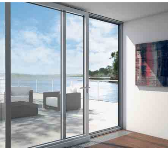
PASK-Fenstertüren bieten variable Lüftungsmöglichkeiten Tilt / slide window doors offer the best possible ventilation options

The non-insulated folding sliding door is the ideal choice in areas where no additional thermal insulation is required. The door system can be opened fully to extend offices, business rooms and living areas.