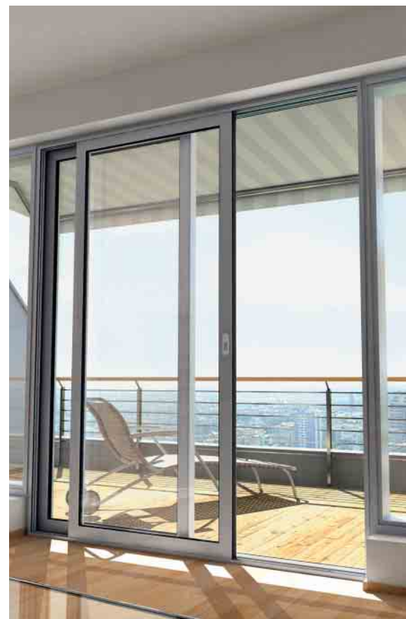
Schüco e-slide – verdeckt liegendes Antriebssystem concealed drive system

As the Schüco e-slide fitting is fully automatic, an anti-finger trap is integrated in the sliding and lift-and-slide systems.