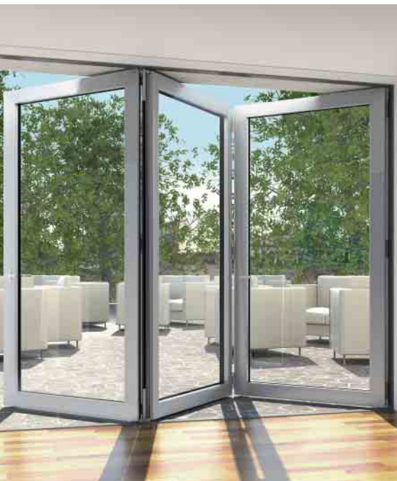
Schüco ASS 70 FD – wärmegeädämtes Faltschiebesystem Schüco ASS 70 FD – thermally insulated folding sliding system