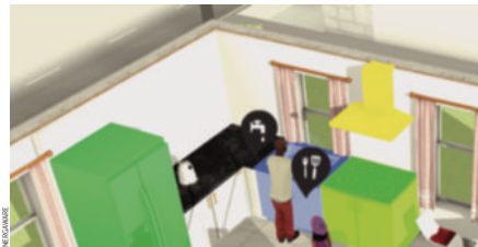
Το EnergyGaware είναι ένα βιντεοπαιχνίδι που συμβάλλει στην εξοικονόμηση ενέργειας.

Το παιχνίδι ανταμείβει δράσεις τόσο απλές όσο το σβήσιμο των φώτων. Οι παίκτες μπορούν να ανταγωνιστούν τους γειτονές τους αναρτώντας στα μέσα κοινωνικής δικτύωσης, Αισθητές τοποθετημένοι σε εξοικονομητές ενέργειας, οι οποίοι έχουν εγκατασταθεί για τους σκοπούς της έρευνας, καταγράφουν τις επιδόσεις των συμμετεχόντων. Η μελέτη θα συνεχιστεί έως το τέλος του έτους. Τον Ιανουάριο του 2018, η ομάδα θα αρχίσει να αναλύει το σύνολο των δεδομένων. Ο προϋπολογισμός του πειράματος φτάνει τα 2 εκατ. ευρώ και χρηματοδοτείται από την Ευρωπαϊκή Ένωση.