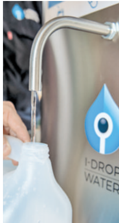
Τα συστήματα φιλτροποίησης της I-Drop μπορούν να εγκατασταθούν σε οποιοδήποτε μαγαζί με πρόσβαση σε νερό της βρύσης, χωρίς κόστος για τον ιδιοκτήτη.

«Εγώ είμαι ο σπασίκλας με τα δεδομένα. Εγώ διαχειρίζομαι την πλατφόρμα συνολικά και κάνω τη διάγνωση προβλημάτων. Είναι εκπληκτικό πόσα μπορείς να συμπεράνεις από