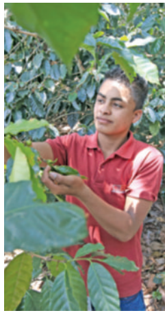
Ένας από τους μαθητές που συμμετέχουν στο πρόγραμμα του E2E, την ώρα της συγκομιδής του καφέ.

Η οργάνωση λαμβάνει χρηματοδότηση τόσο από τους Ροταριανούς των ΗΠΑ και την τράπεζα Banrural, χάρη στην οποία έχει τη δυνατότητα να παρέχει στους μαθητές που επιλέγονται τον απαραίτητο εξοπλισμό, καθώς και τουλάχιστον το 60% των διδάκτρων τους. Το ποσοστό αυτό αυξάνεται με κάθε έτος φοίτησης που περνάει.