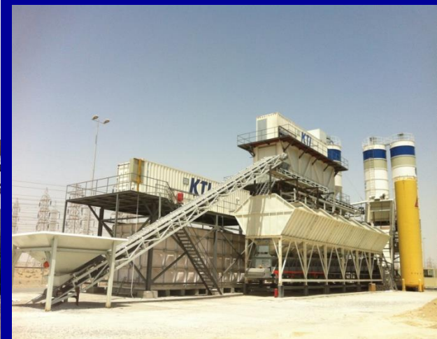
FLAKE ICE PLANT