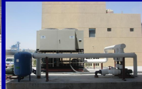
FEB CO Ready Mix Factory – Kabd