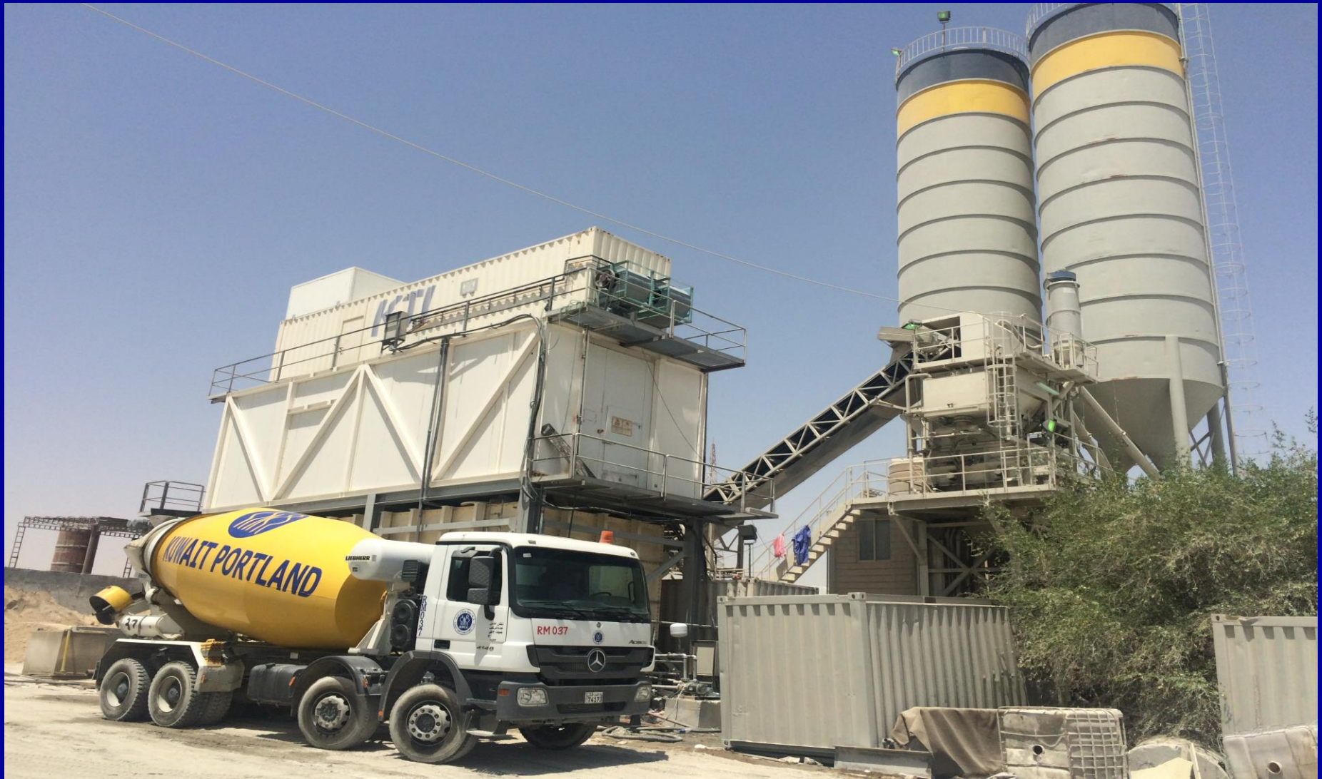
Kuwait Portland Cement Co.