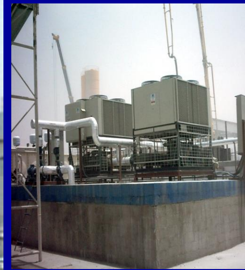
Sitco Ready Mix Co.- Kabd