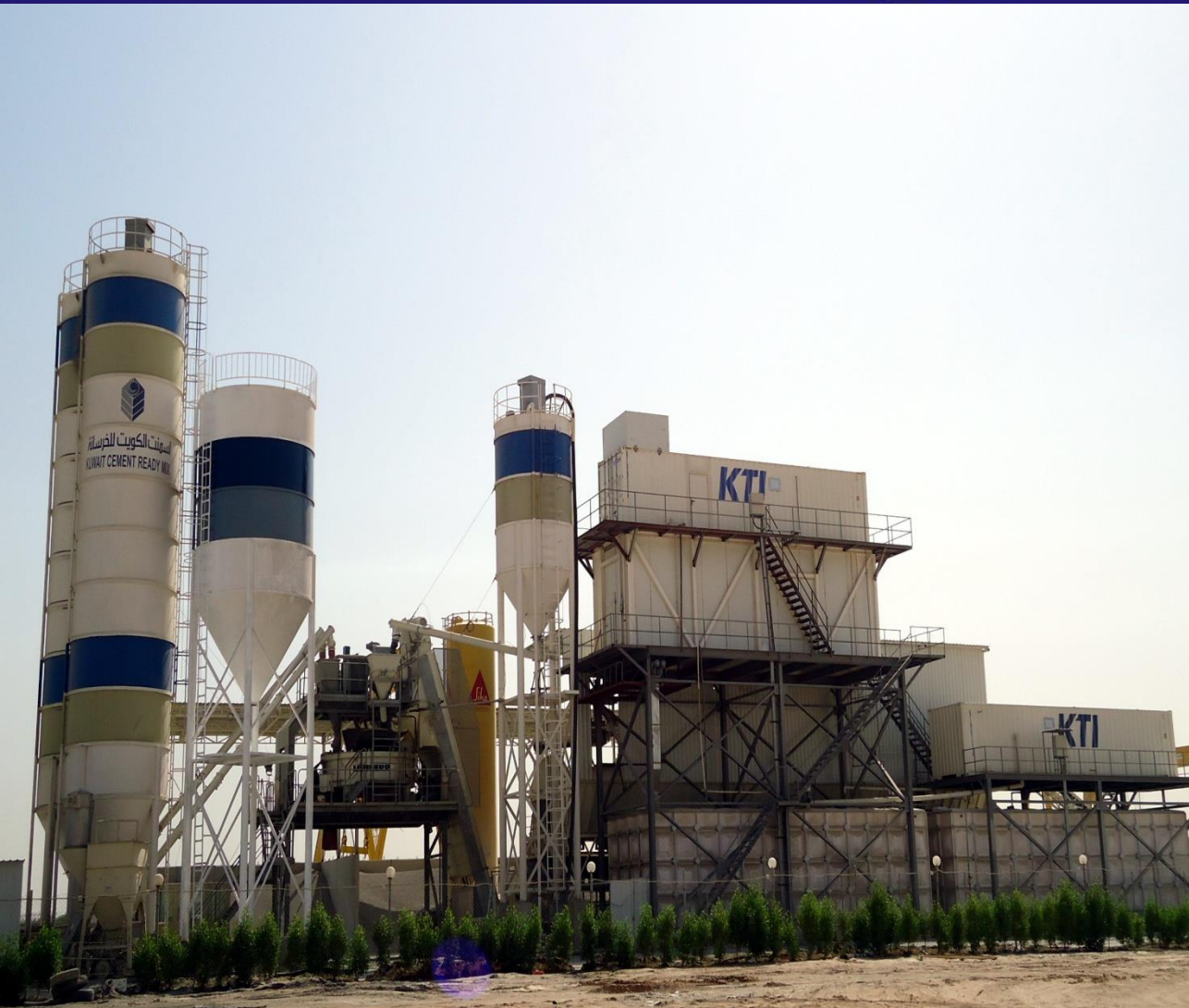
KUWAIT CEMENT R M CO.