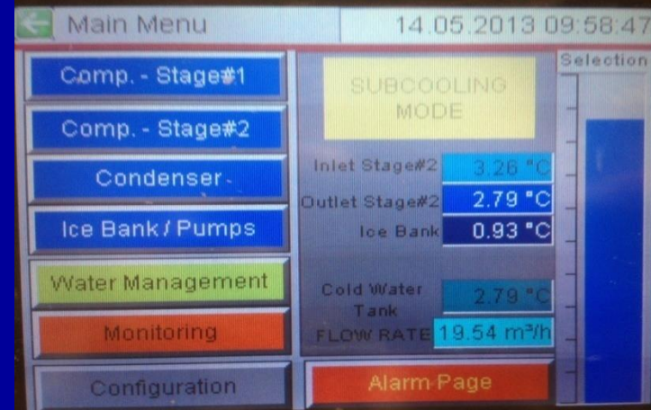
Ice Water Chiller – CIWP 186