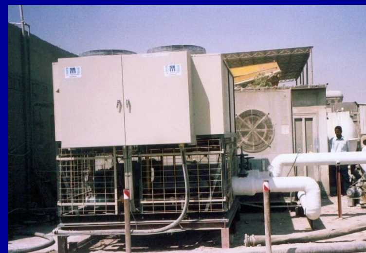
1 No. SKM Chiller