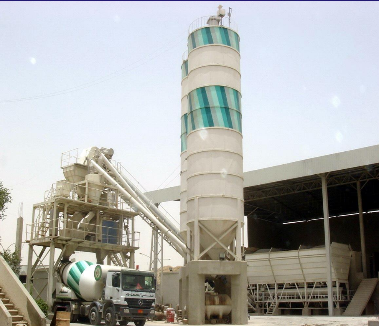
QATAMI READY MIX CO.