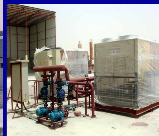
2 Nos. SKM Chillers