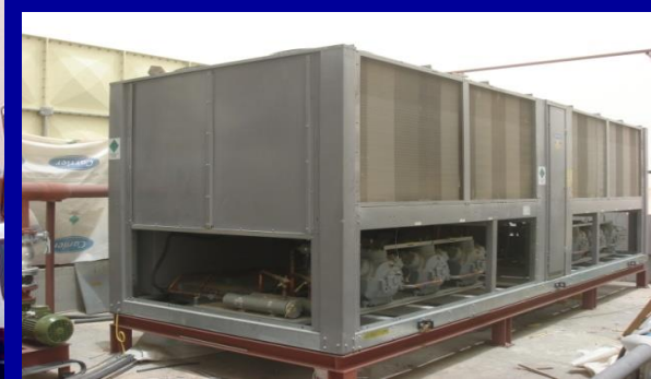
K-Mix Ready Concrete Co. – Amghara