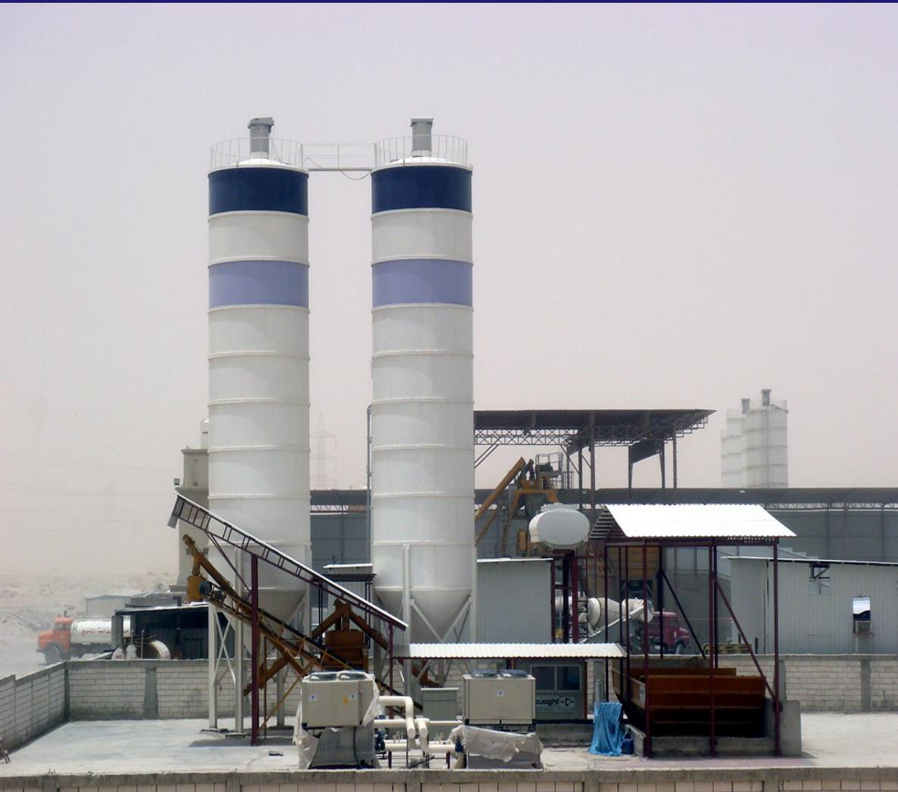
Union Construction Co.