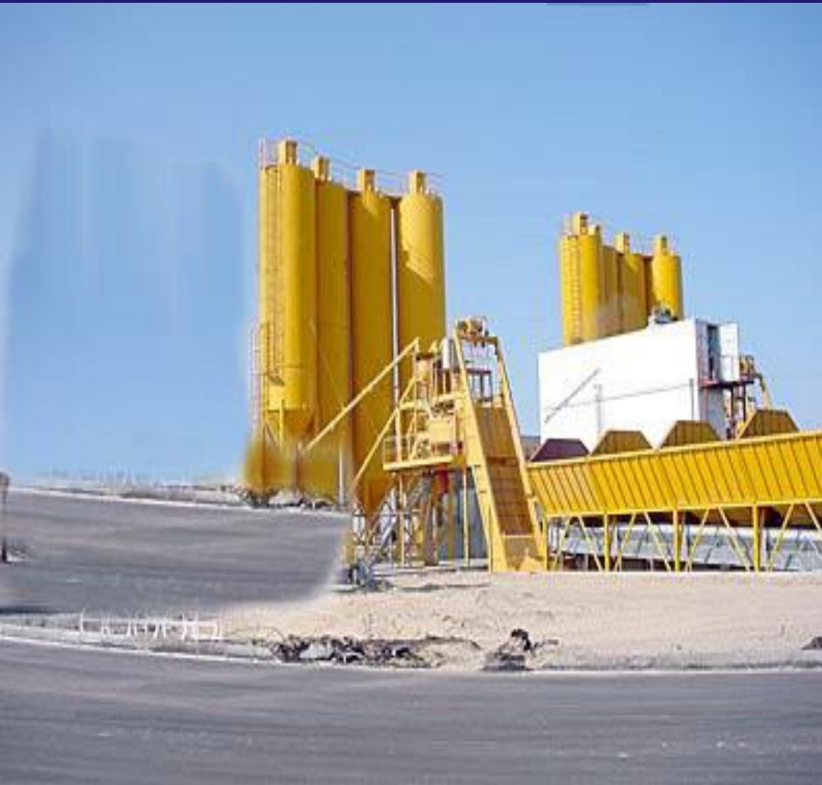
Wataneya Ready Mix Co.