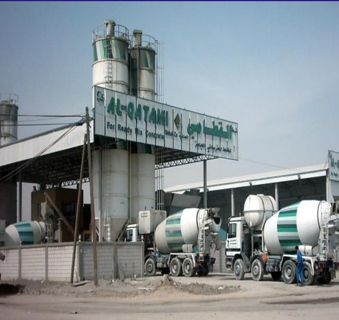
Al Qatami Ready Mix Concrete