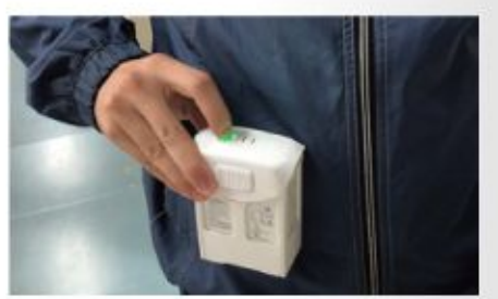
* 残量チェックランプは上に点灯