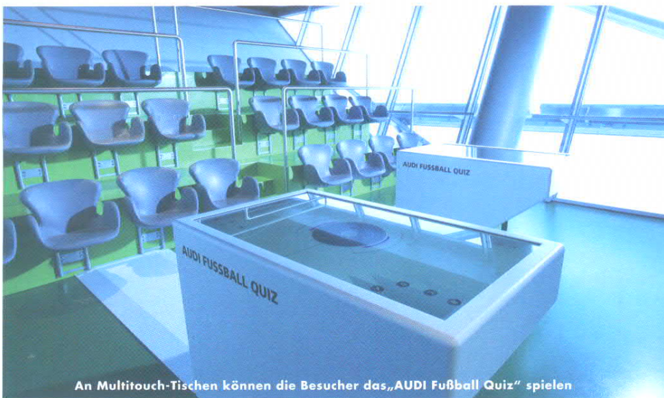
An Multitouch-Tischen können die Besucher das „AUDI Fußball Quiz“ spielen