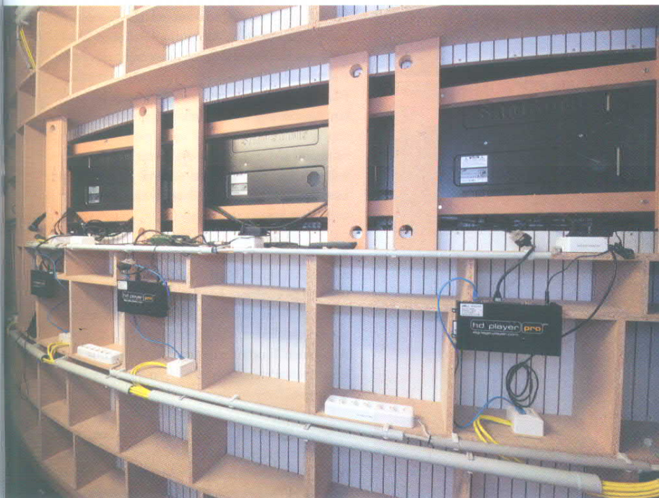
Professional System 4.2012