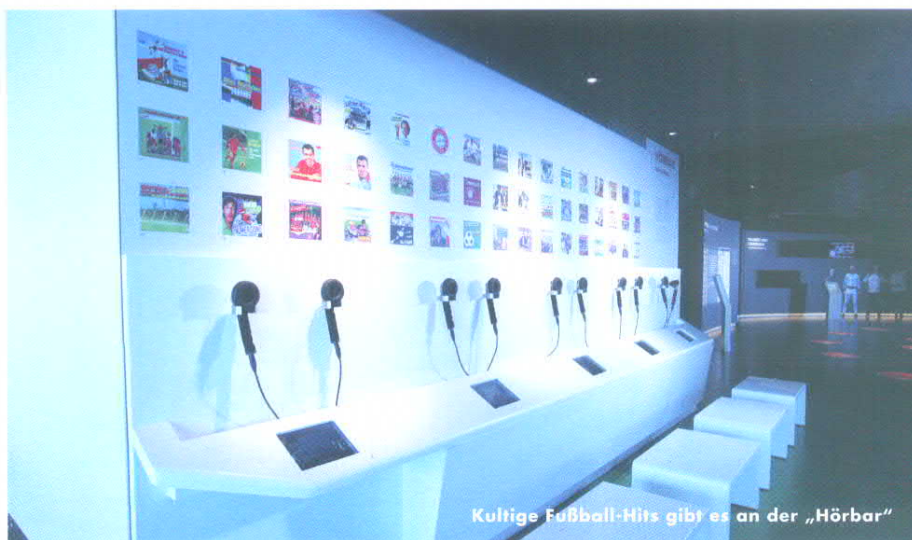
Kultige Fußball-Hits gibt es an der „Hörbar“