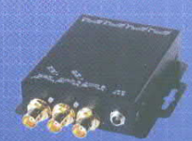
DAS 1-6 Distribution Amplifier 1 x 6 3G/HD/HD-SDI mit Reclocking