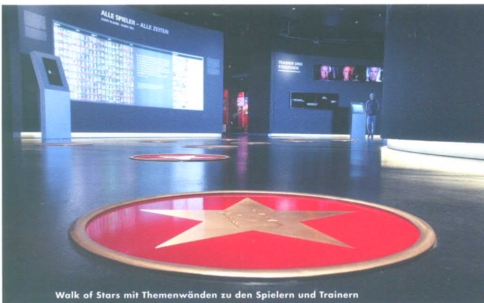
Walk of Stars mit Themenwänden zu den Spielern und Trainern