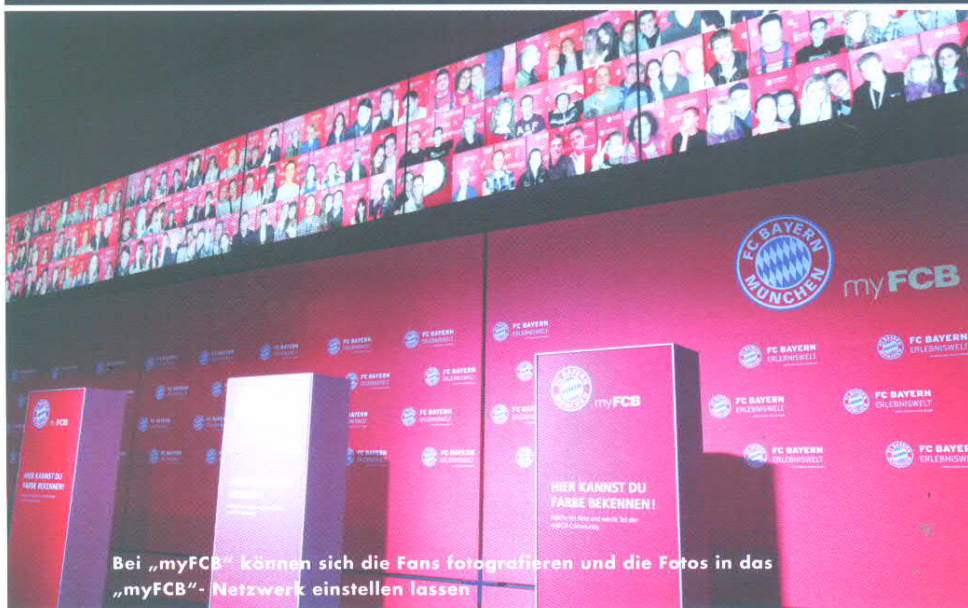
Bei „myFCB“ können sich die Fans fotografieren und die Fotos in das „myFCB“- Netzwerk einstellen lassen