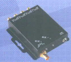
DAS 1-4 Distribution Amplifier 1 x 4 3G/HD/HD-SDI mit Reclocking