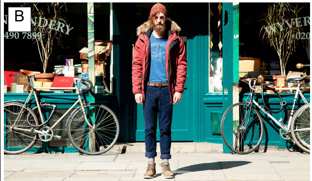
B Un hipster en bonnet de laine et doudoune est pris en photo en plein mois de juillet entre les vélos de ses deux grands-pères.