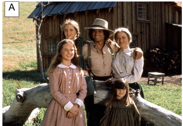
A Une famille de cadres supérieurs, adepte du bio et des circuits courts, s'appête à se rendre à l'office.

Associez chacune des photographies à un espace du schéma.