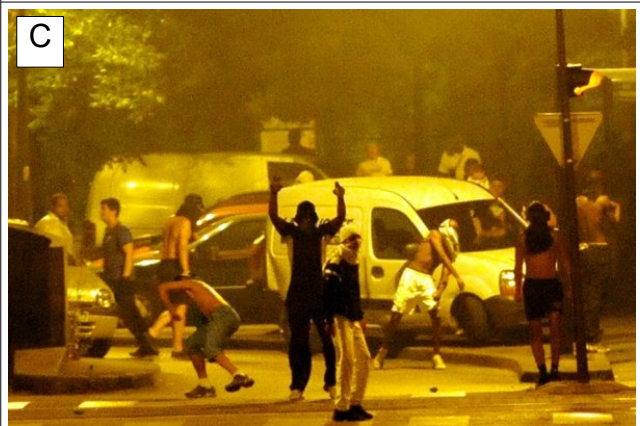
C Des jeunes éternés après le 452 e contrôle policier de la journée