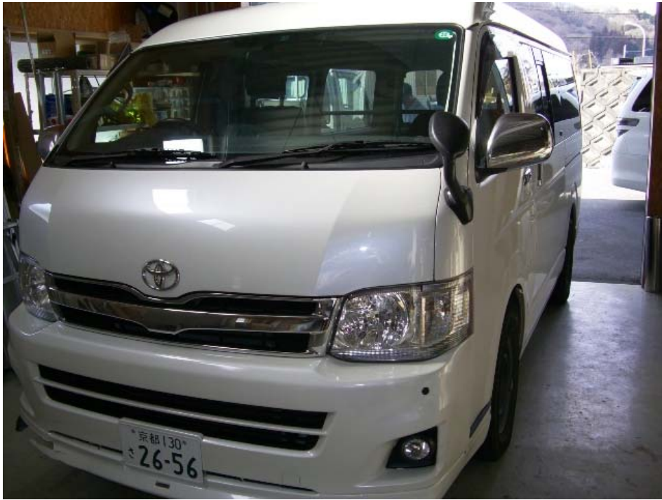
イオンウォッシュ洗浄詳細写真