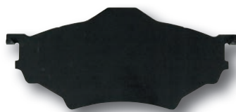
Lamella antivibrazione (clip-on normale)