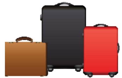
น้ำหนักกระเป๋า 20 กิโลกรัมต่อท่าน

** เนื่องจากเป็นค้ำจิป จึงไม่สามารถตรวจสอบอาหารได้ **