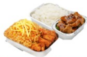
บริการอาหารร้อน ไป-กลับ บนเครื่อง

** เนื่องจากเป็นค้ำจิป จึงไม่สามารถตรวจสอบอาหารได้ **