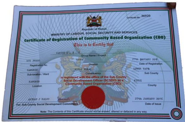
Oprichting Kamiti CBO

Kamiti betekend in de taal van de Kamba "voor bomen". Het is een lokale organisatie opgericht door de boeren zodat zij hulp kunnen krijgen hun eigen land te herstellen (waarom de boeren hulp nodig hebben ga ik hier niet beschrijven). Het herstellen doen ze vooral met de aanplant van meer bomen. Deze lokale organisatie plant bomen op eigen land. Er zijn ongeveer 100 families aangesloten aan de Kamiti groep. De financiële middelen die nodig zijn voor dit project komen van de Forest Market foundation en haar donateurs.