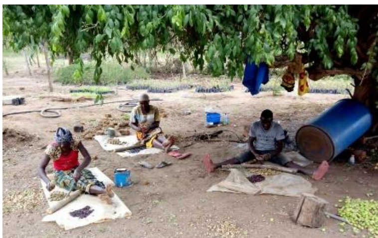
Het kweken van jonge Melia bomen

Ik hoop dat ADRA komende week betaald heeft zodat ook wij goed het kerstfeest in kunnen gaan.