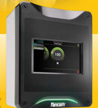
Elektronische regelaar voor pluimveestallen