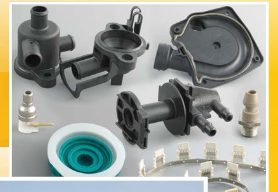
Kunststof onderdelen voor de automotive en andere industrieën

Met hoge precisie gegoten kunststof onderdelen