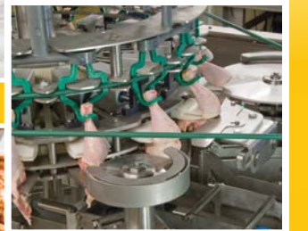
Verwerking van drumsticks