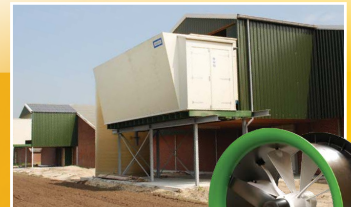
Luchtwassers en luchtfilters

Management, regelunits en software, luchtwassers