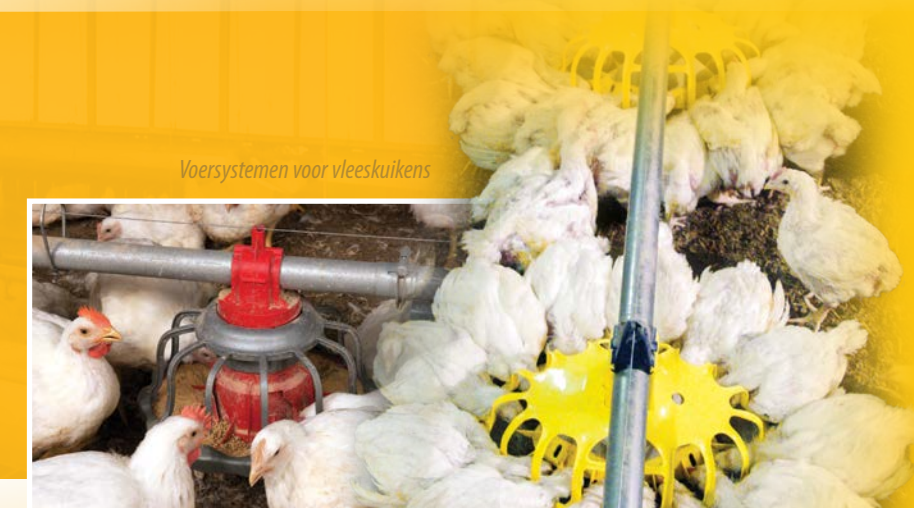
Voersystemen voor vleeskuikens

Systemen voor voer, water, lucht, temperatuur en huisvesting