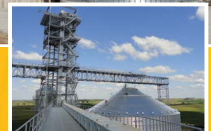
Constructies voor graaninstallaties

Verwerking tot eindproduct: voer, voedsel, biobrandstoffen