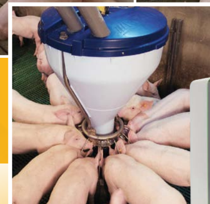
Voeren van biggen

Voer, water, lucht, temperatuur en technologie