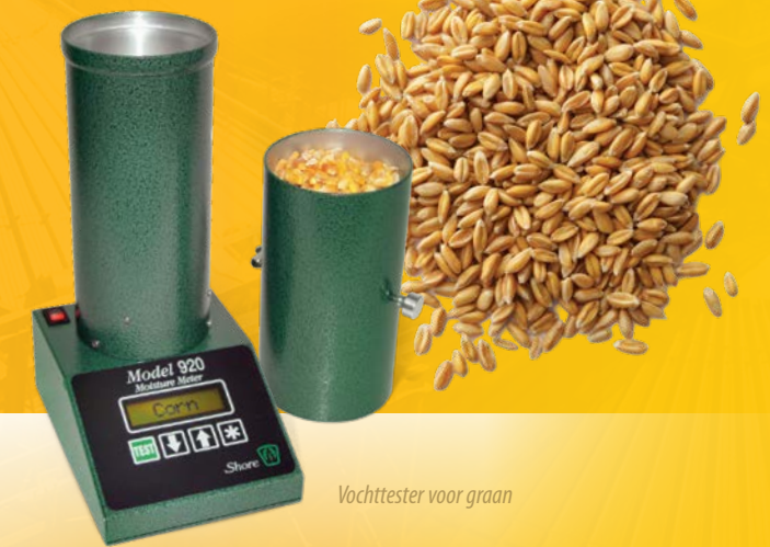
Vochttester voor graan