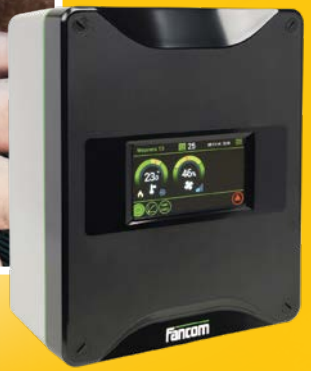
Elektronische regelaar voor varkensstallen