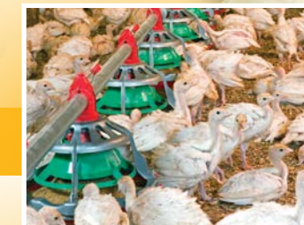
Voersysteem voor kalkoenen