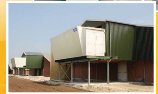
Luchtwassers en luchtfilters