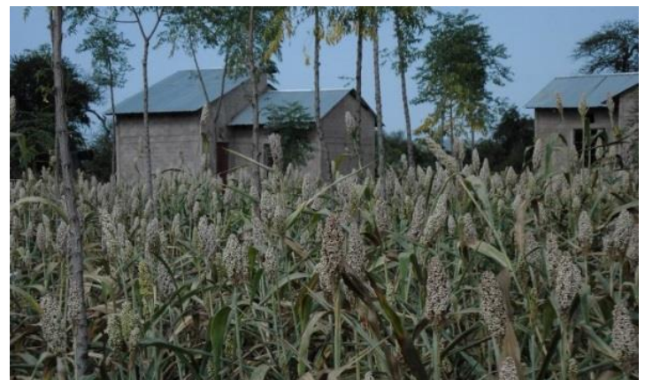
Dit is Agro-forestry nog geen Permacultuur

In mijn zoektocht naar een systeem - waarin AWG economische waarden kan creëren en tegelijkertijd biodiversiteit, en de omgeving kan herstellen - ben ik bij Permacultuur terecht gekomen. Bij het toepassen van deze methode van land inrichten, creëer je zowel natuurwaarde alsook een omgeving waar de mens uit kan oogsten voor zijn dagelijkse levensbehoeften. Deze manier van land inrichten zal door de diversiteit aan flora en fauna, gecombineerd met het fascinerende karakter van een voedselbos waar vrijwel alles eetbaar/bruikbaar is, wel bezoekers trekken.