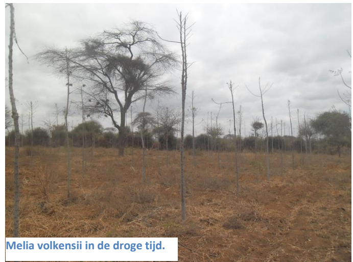
Melia volkensii in de droge tijd.

Het is "herfst" bij AWG, nou ja de bladeren zijn van de bomen gevallen. Alles gaat rustiger aan, het bos is in stilstand en wacht op water. In het droge seizoen kan Melia volkensii - om verdamping tegen te gaan - zijn blad laten vallen. Als de regentijd start, groeien de blaadjes weer razendsnel aan en kun je de bomen haast 'zien' groeien. Bij oudere bomen, zie je dat zij ook in de droge tijd hun blad behouden. Als dit bos dat stadium bereikt zal er het hele jaar verkoeling gevoeld worden door de constante verdamping.