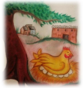
Voorbeeld uit het boek.