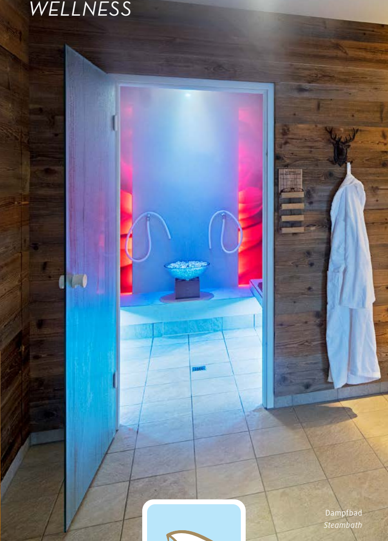
Dampfbad Steam bath