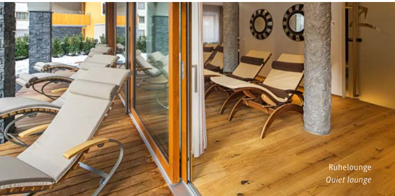
Ruhelounge Quiet lounge