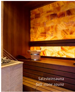
Salzsteinsauna Salt stone sauna