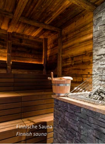
Finnische Sauna Finnish sauna