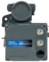
DVC6000/6200 FIELDVUE® (Remanufacturados)