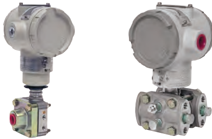
STA, STD & STG Transmitters