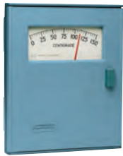
Transmisor Indicador Neumático 45P