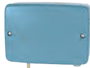
Transmisor Neumático Serie Ciega 44B