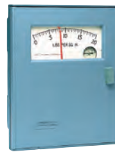
Controlador Indicador Neumático 43AP