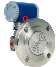
IDP10/PSFLT Diafragma rasante