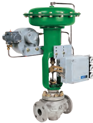
Válvulas De Vastago Deslizante