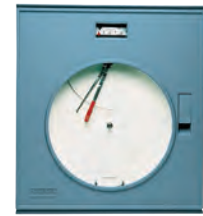
Registrador o Controlador Indicador Neumático 40P