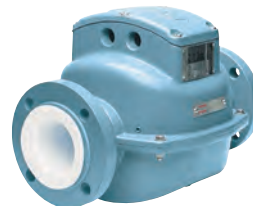
Caudalímetro Magnético 2800