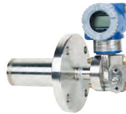
IDP10/PSFLT Diafragma extendido