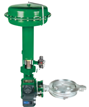
Válvulas De Mariposa

Varias series en tamaños de válvula de control y clasificaciones ANSI. Todas las válvulas están disponibles en opciones metálicas y acabados especializados. Llame para obtener más detalles.