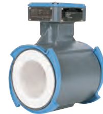
Tubo de caudal magnético 800A