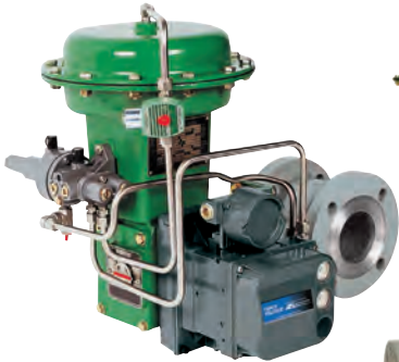
Válvulas De Esfera