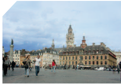
Grand Place Lille

Près d'Euralille et des gares, à moins de 3 km du vieux Lille, un nouveau quartier est en train de naître. Conçu sur l'ancien site de Fives Cail Babcock, dans le respect d'un patrimoine et de traditions vivaces, il recompose ce vaste espace pour créer toutes les conditions du bien-être en ville. A la proximité des commerces, des services et des activités économiques s'ajoutera la diversité