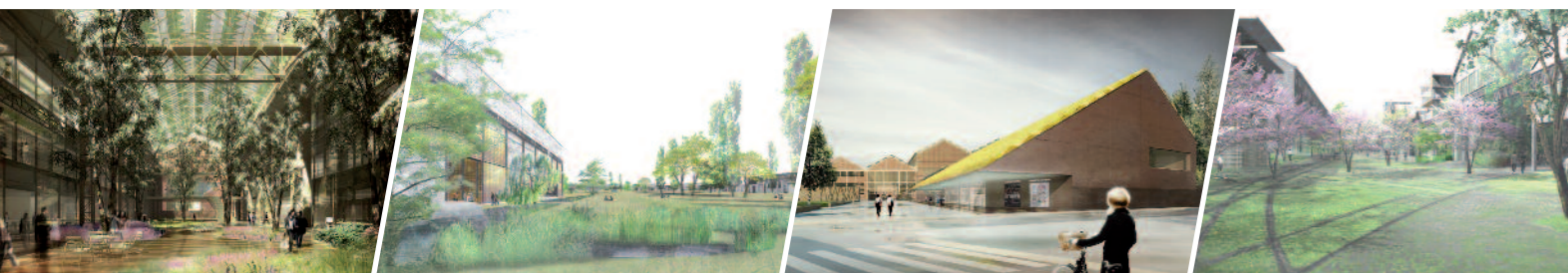
Rue couverte dans le lycée hôtelier Michel Servet*