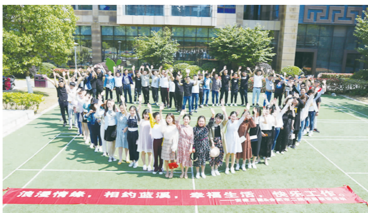
参与活动的青年职工表示，本次活动形式新颖，以拓展带联谊，让大家在放松身心的同时寻觅缘分、结交朋友，在活动中埋下了友谊和爱情的种子。（徐虹）

安徽三建和合肥市二院因工程结缘。2016年安徽三建承建合肥市二院新区项目，凭借高效的服务、优质的工程质量赢得了甲方的高度评价，双方建立了良好互信。今年安徽三建顺利承接了合肥市二院老年护理院项目。两次合作让公司和合肥市二院结下了深厚的友谊。在合作中，双方发现正在不断扩张的合肥市二院里未婚女职工比例较高，而身为建筑企业的我公司则盛产“优质男”，于是就有了这次甲方和乙方的深度合作活动。