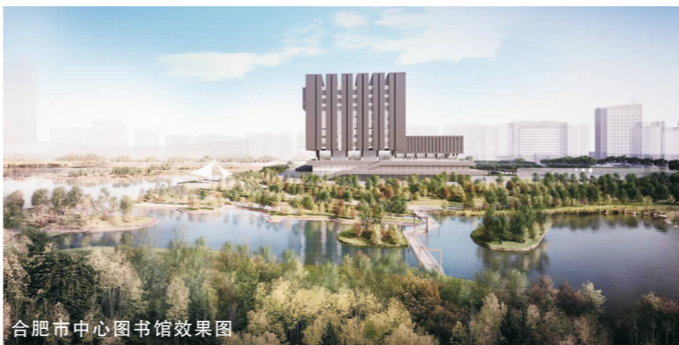
合肥市中心图书馆效果图

市场经营部表示,下一阶段将继续坚持公司“大客户”发展战略和“走出去”发展战略,在保持传统经营工作