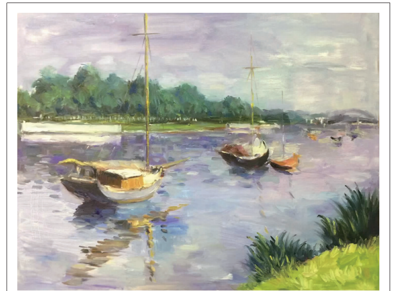
职工书法绘画作品选登

我想这就是旅行的意义。这些走过的路，受过的人，品尝过的食物，看过的风景，都会让自己和最真实的自己不期而遇。