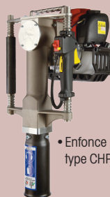
• Enfonce pieux type CHPD-78

Enfoncement à l'aide d'une masse ou d'un outil à percussion (marteau pneumatique, enfonce pieux...), en fonction de la taille de la bascule et du type de sol. Différents modèles de barre de frappe disponibles.