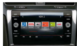
Golf Comfortline & Carat : Composition Media