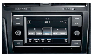
Golf Start : Composition Colour