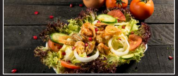
Seafood Salad 4.9 سلطة بحرية

Seaweed, Wood Ear Mushroom, String Agar, White Sesame Seeds, Chilli, Soy Sauce, White Vinegar Sauce, Sesame Oil, served with Prawns عشب بحري، فطر، أغار، بذرة السمسم الأبيض، فلفل حار، صلصة الصويا، صلصة الخل الأبيض، زيت السمسم، يقدم مع الربيان