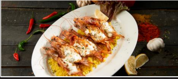
Santorini Queens 6.9 ربيان سانتوريني

7 Queen Prawns, topped with Creamy Garlic Sauce and Feta Cheese, then baked and served with Jimmy's Rice