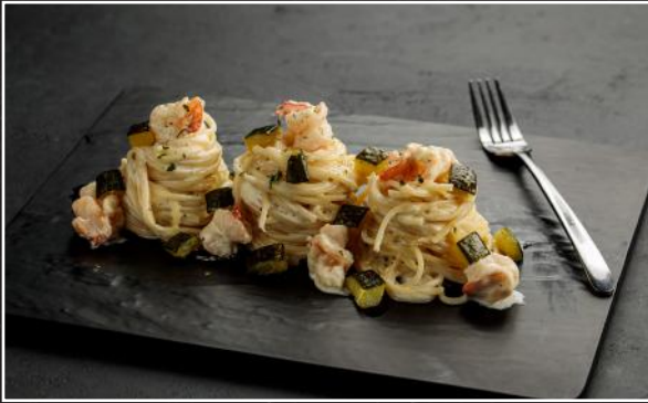
Prawn and Zucchini Pasta