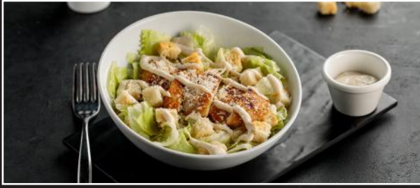
Chicken Caesar Salad 2.9 سلطة سيزار الدجاج

Grilled Chicken Strips, fresh Garden Salad, Croutons, with Caesar Dressing قطع من صدر الدجاج المشوي، سلطة خضراء طازجة، خبز محمص، مع صلصة السيزار