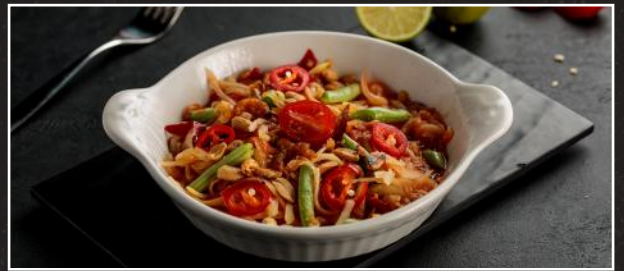
Green Papaya Salad 3.5 سلطة البابايا الخضراء

Add Halloumi Cheese اضع جبنة حلوم 1 Add Chicken اضع قطع الدجاج 1