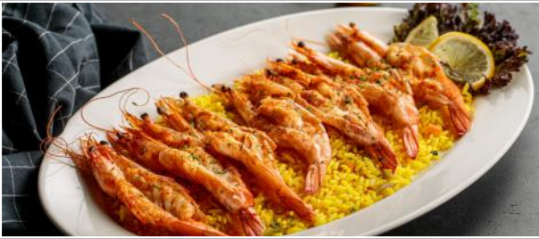
Original Killer Queens 6.9 ربيان كوين من الحجم الكبير

٧ قطع ربيان كوين من الحجم الكبير مطبوخة في صلصة الليمون والزبدة والثوم الخاصة، تقدم مع رز جيميز