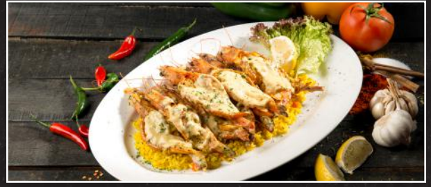
Mozambique Queens 6.9 ربيان موزمبيقي

٧ قطع ربيان كوين من الحجم الكبير مغطاة بصلصة الكريمة بالثوم وجبنة الفيتا، تقدم مع رز جيميز