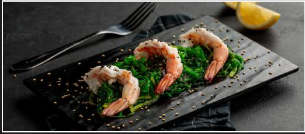
Prawns and Seaweed Salad 3.5 سلطة الربيان وعشب البحر

Lettuce, Tomato, Cucumber, Bell Pepper, Onion, Olives, Feta cheese with Greek Salad Dressing خس، طماطم، خيار، فلفل حلو، بصل، زيتون، جبنة الفيتا مع الصلصة اليونانية