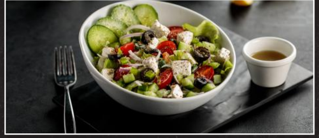
Greek Salad 2.9 سلطة يونانية

Grilled Chicken Strips, fresh Garden Salad, Croutons, with Caesar Dressing قطع من صدر الدجاج المشوي، سلطة خضراء طازجة، خبز محمص، مع صلصة السيزار