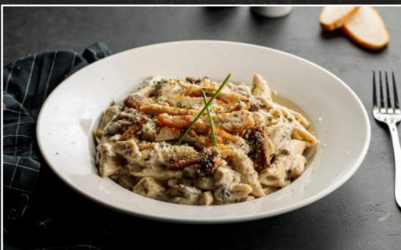
Creamy Chicken and Mushroom