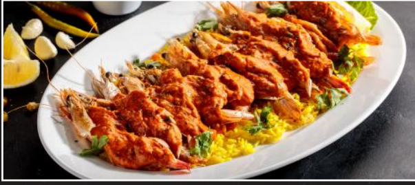
Kashmiri Queens 6.9 ربيان كشميري

٧ قطع ربيان كوين سوتيه من الحجم الكبير مطبوخة في صلصة الكريمة بجوز الهند، تقدم مع رز جيميز