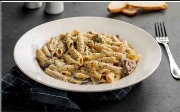
Creamy Mushroom Pasta