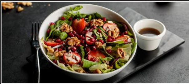
Jimmy's House Salad 3.0 سلطة جيميز

Prawns, Mussels, Calamari, Lettuce, Pomegranate, Tomato, Onion, Cucumber, served with Honey Mustard Dressing ربيان، مكار، كالاماري، خس، رمان، طماطم، بصل، خيار، تقدم مع صلصة الخردل والعسل