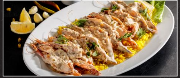
Lemon Pepper Lemonaise Queens 6.9 ربيان ليمونيز مع الليمون والفلفل الأسود

٧ قطع ربيان كوين من الحجم الكبير مطبوخة في صلصة الكشميري الخاصة، تقدم مع رز جيميز