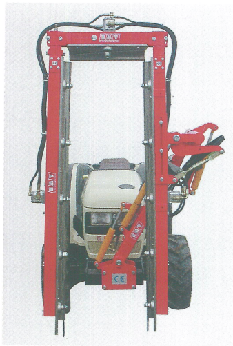
Modell DE800A mit Top 1 Festmesser

Für den Straßenverkehr wird die Maschine in Länge und zum Zentrum der Zugmaschine eingezogen, somit werden Hindernissen vermieden.