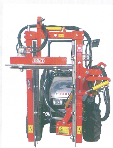
Modell DE800B mit Top 2 höhen verstellbare Messer

Für den Straßenverkehr wird die Maschine in Länge und zum Zentrum der Zugmaschine eingezogen, somit werden Hindernissen vermieden.