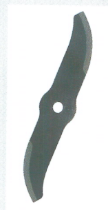
Messer Typ Saber

TECHNISCHEN DATEN: HYDRAULISCHER MOTOR CC. 6,2 MENGE ÖL-NACHFRAGE = 22 Lt. DRUCK FÜR DEN EINSATZ = 130 BAR FAHIGKEIT ZUR ARBEIT = 0,8 ÷ 1,2 (ha/h)