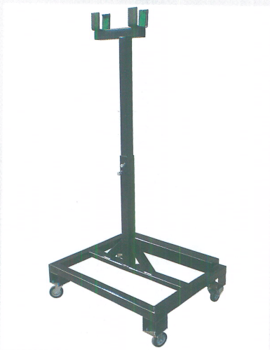
Wagen mit Räder für Maschinenstillstand

Die senkrechte Schnittstrichscheibe ist mit einer Feder ver- bunden, die im Falle von Hindernissen sich automatisch ein und ausklappt