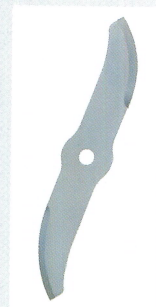
Messer in Edelstahl poliert