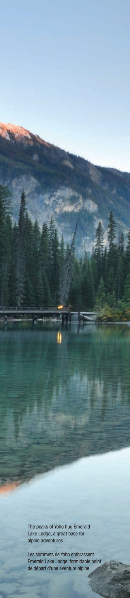
The peaks of Yoho hug Emerald Lake Lodge, a great base for alpine adventures.