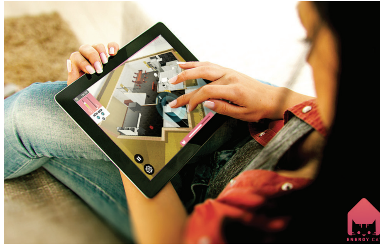
Une jeune femme jouant au EnerGAware.