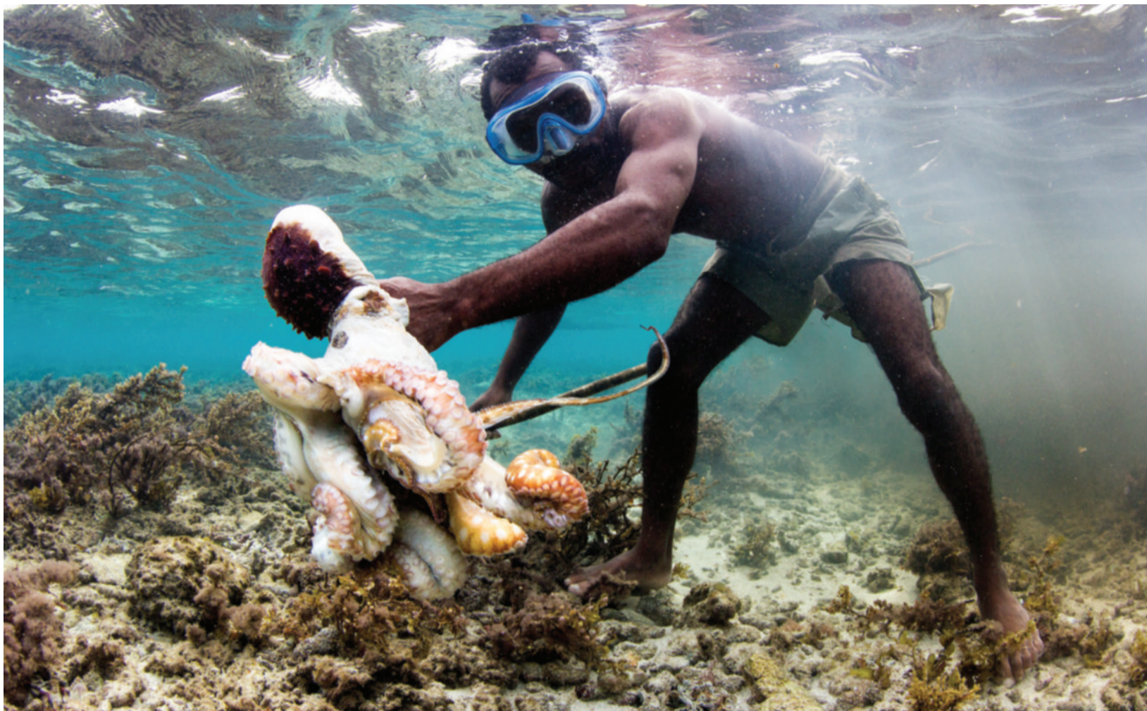
Un pêcheur de poulpe, de l'ethnie Vezo à Madagascar.

Les zones de protection marine sont d'ordinaire imposées aux com-