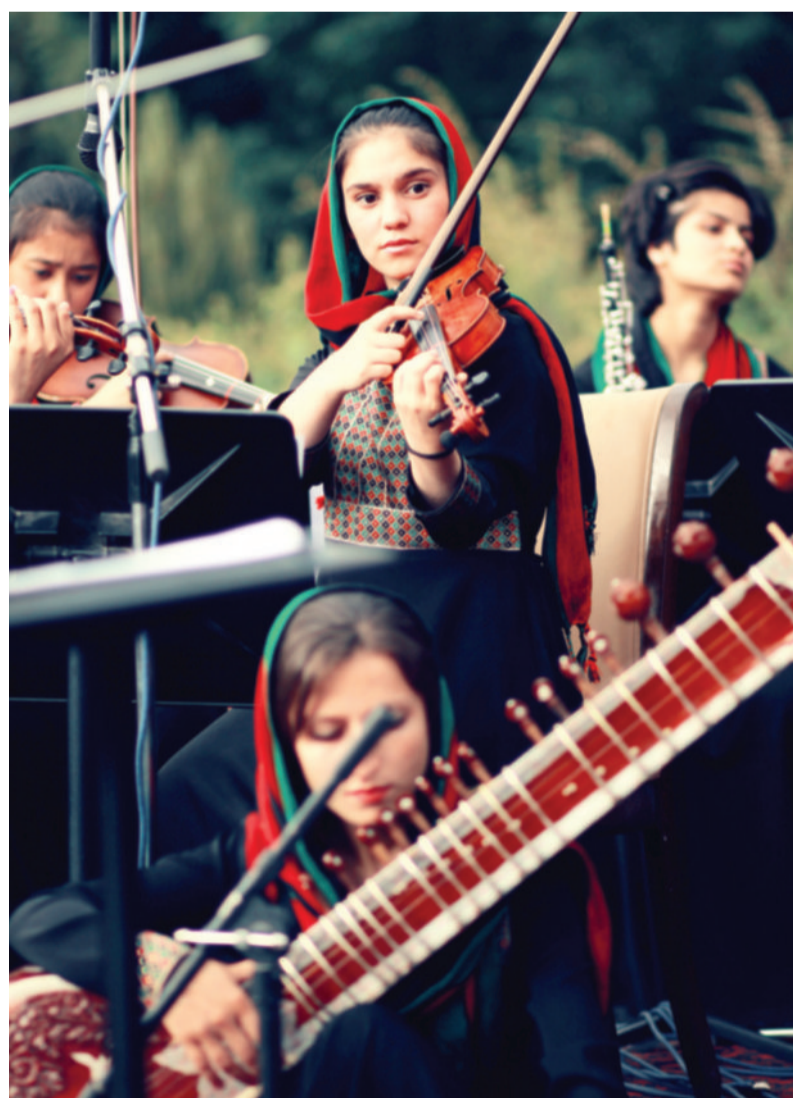
Des musiciennes de l'orchestre Zohra.

À l'Institut national de musique d'Afghanistan, des élèves riches et des orphelins suivent les cours de la musique sous le même toit. Ils jouent leur douleur, leurs espoirs, leur joie et leur chagrin afin qu'un jour ils arrivent à réaliser leurs beaux rêves d'enfance. Comme l'indique Ahmad Nasser Sarmast : « L'Institut national de musique d'Afghanistan est comme une île d'espoir dans l'obscurité. Cet institut est le symbole de l'Afghanistan de demain. »