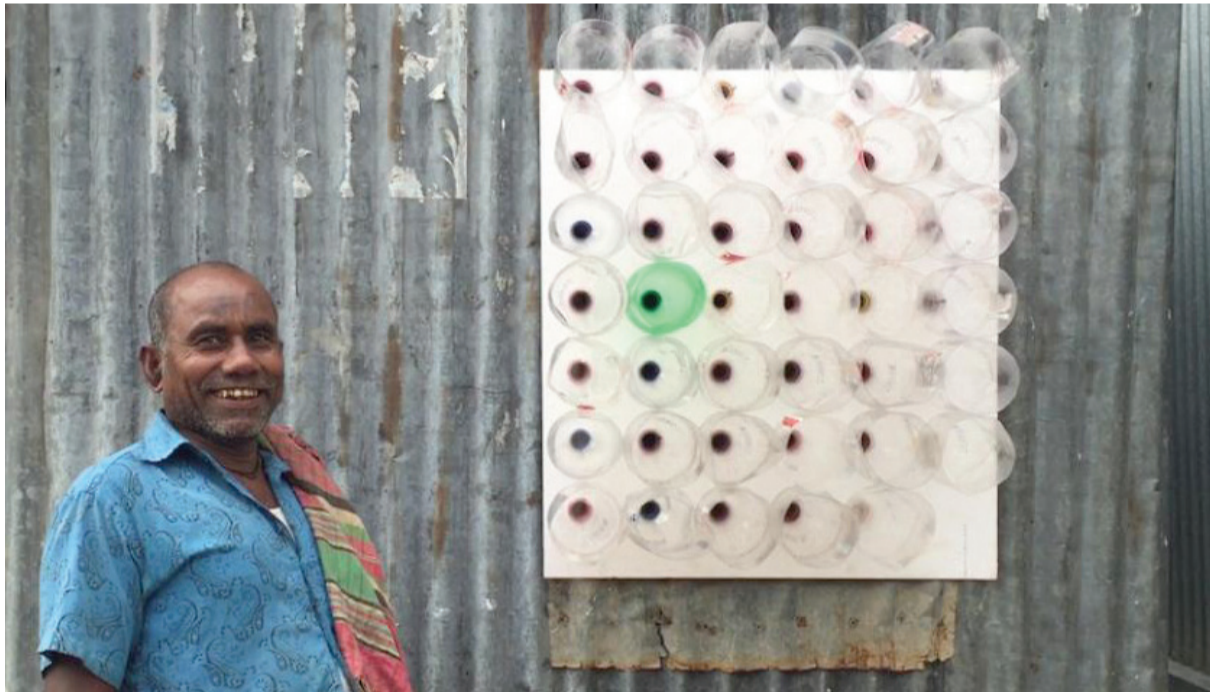
Le Eco-Cooler est une clim qui fonctionne sans électricité, mais avec des bouteilles en plastique.

Quand de simples bouteilles en plastique permettent de rafraîchir tout une pièce.