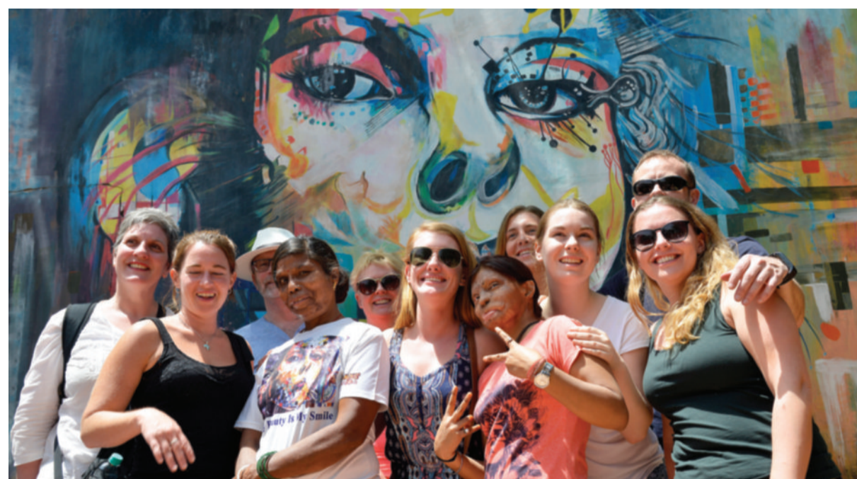
À Agra, en Inde, les gérantes du Sheroes Hangout, qui ont survécu à des attaques à l'acide, et des clientes.