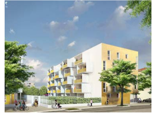
Avenue Marcel Paul