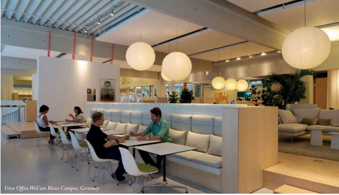
Vitra Office, Weil am Rhein Campus, Germany

Planlama tıpkı eskiden köy çeşmesinde şimdi ise kafelerde olduğu gibi insanları bir araya getiren yollar, resmi olmayan karşılaşma fırsatları, hedef noktalar gibi yarattığımız şehir dokusuna benzer şekilde yapılır.