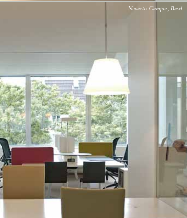
Novartis Campus, Basel

Increasingly, clients come to us with Aspirational and Qualitative Visions, rather than numeric Quantitative Briefs. Collaboration, Communication, Interaction, Teamwork, Flexibility, Agility, Client Centricity, etc. are all key topics. They look for the Project to act as a vehicle for cultural & behavioural change, rather than as a makeover, or a number crunching exercise.