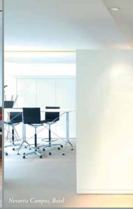
Novartis Campus, Basel