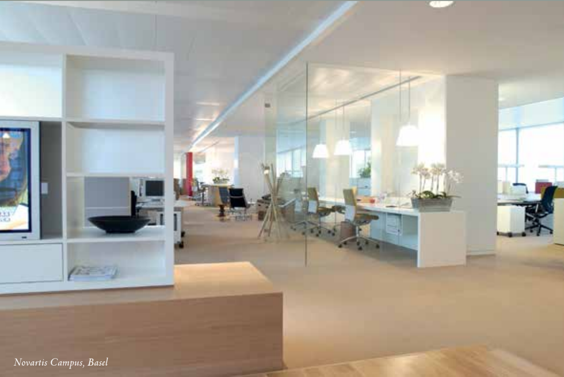
Novartis Campus, Basel