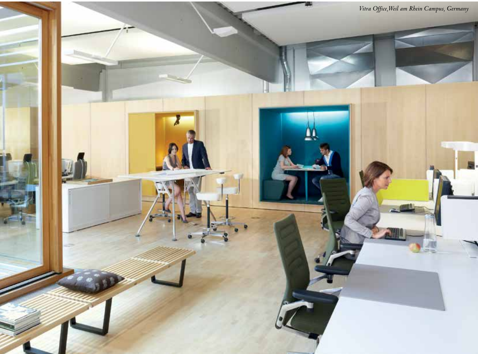
Vitra Office, Weil am Rhein Campus, Germany

Different sectors have different organisations and operational methodologies and as such the design of the workplace needs to recognize this. Whilst there are common threads, the philosophy of one size fits all, is not appropriate.