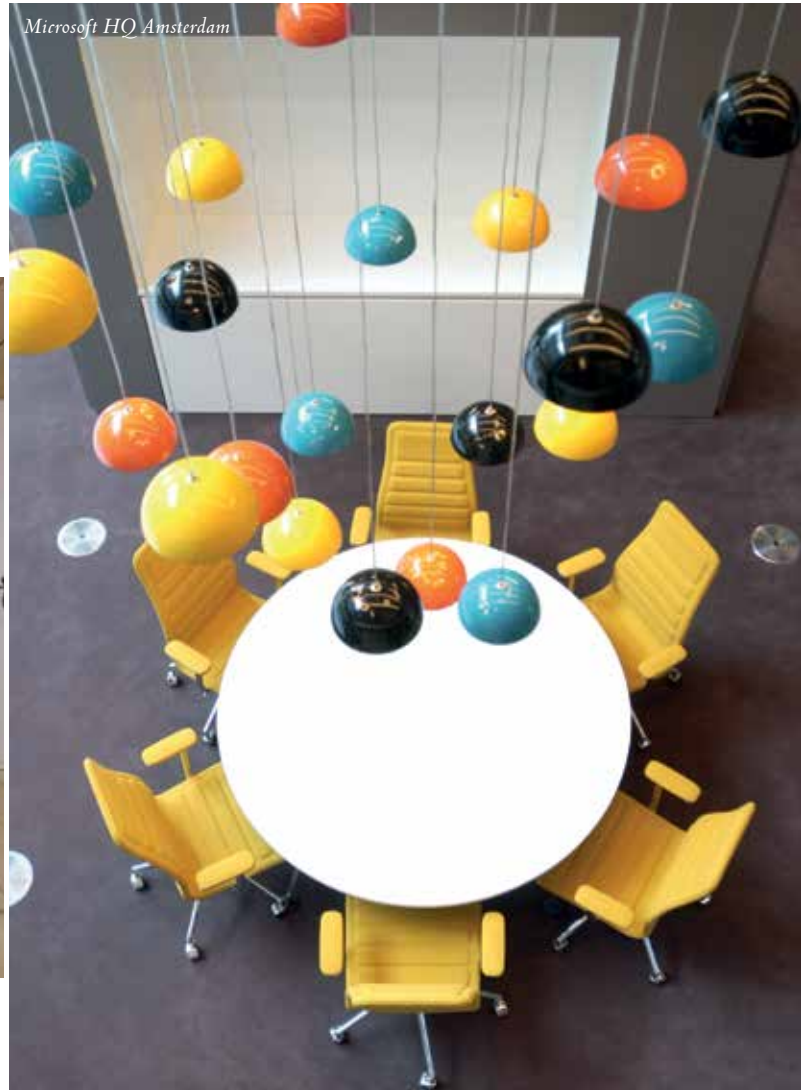
Microsoft HQ Amsterdam