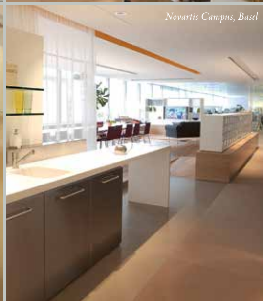
Novartis Campus, Basel