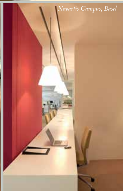
Novartis Campus, Basel