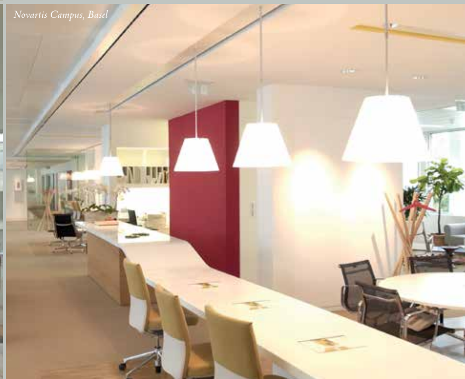
Novartis Campus, Basel