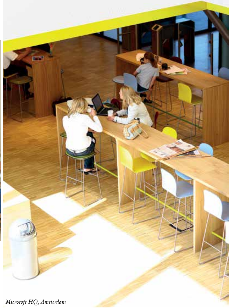
Microsoft HQ, Amsterdam

Bu değişimlere uyulsa bile veya onlara rağmen ofisin önemi şirket ve çalışanlar için hâlâ devam ediyor ancak üzerine yeniden odaklanılıyor ve giderek artan bir şekilde etkileşim noktası olarak görev yapıyor. İnsanlar sosyal hayvanlardır ve diğerleriyle fiziksel yakınlık kurduklarında en iyi şekilde öğrenir ve iletişime geçerler. Hepimizin, sonsuz sayıda karşılıklı e-postalar göndermek yerine yüzyüze tartışarak daha çabuk fikir geliştirme ve problem çözmeye dair ilk elden deneyimlerimiz vardır. Ofisin bir odak noktası ve kolaylaştırıcı olma rolü olmuştur ve bundan sonra da olmaya devam edecek.