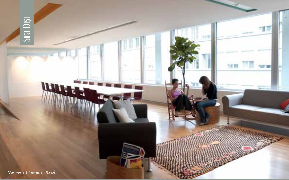
Novartis Campus, Basel