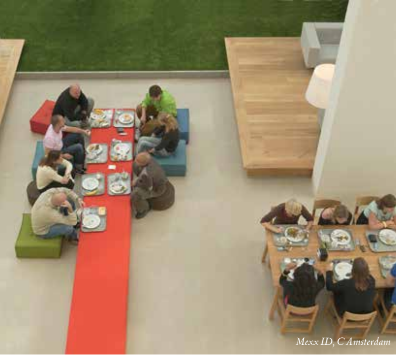
Mexx ID, C Amsterdam

• Ofis iç mekân tasarımında son dönem trendler ve konseptler neler? Sizce geleceğin ofisleri nasıl olacak?