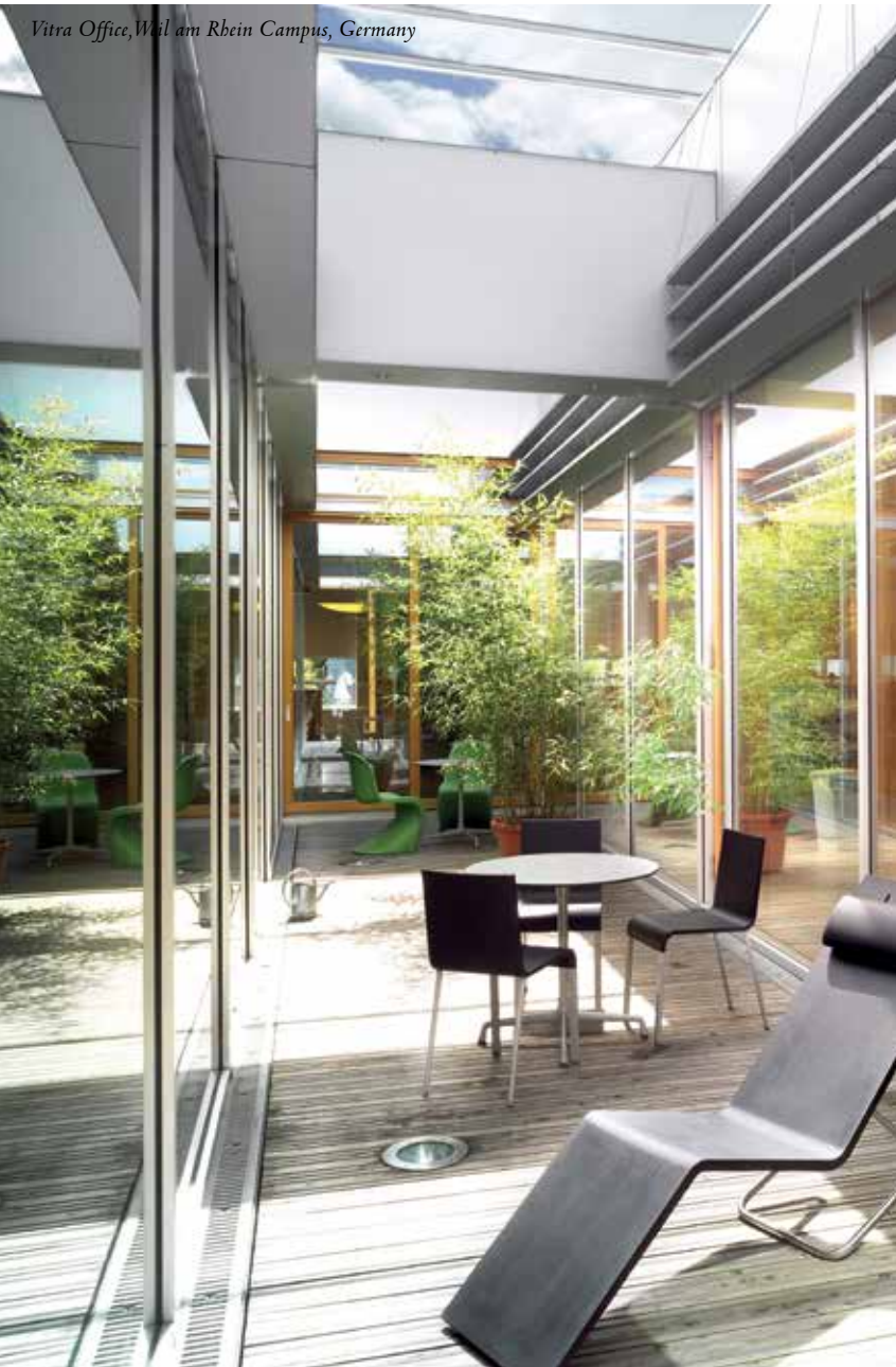
Vitra Office, Weil am Rhein Campus, Germany