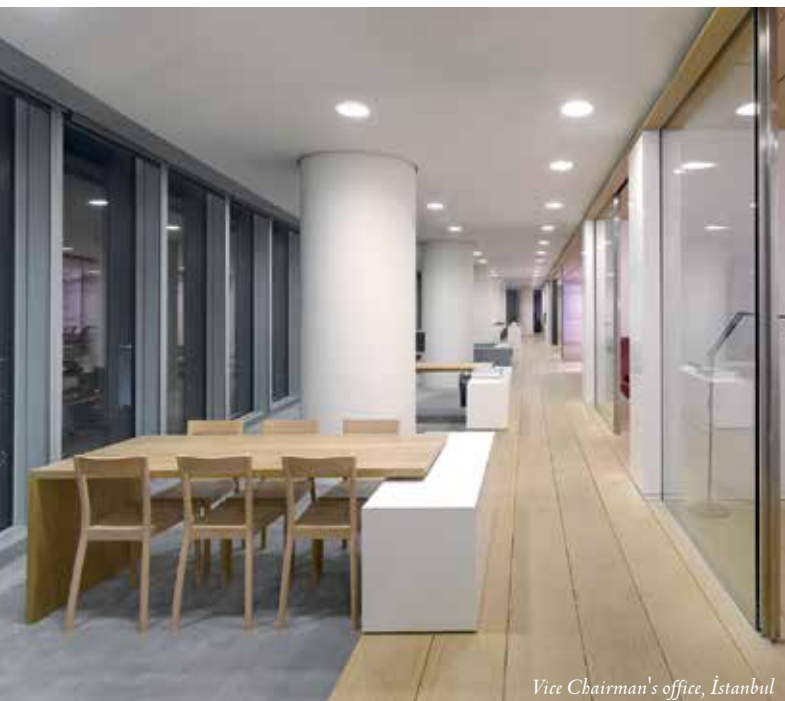
Vice Chairman's office, İstanbul

As we have just about covered most topics and challenges in our large workplace experiences, we would like to apply this expertise to educational and medical projects. We would also like to work with Developers and architects to bring about better solutions right from the onset, that provide more appropriate spaces and facilities that are now needed to support the changing workplace. ■