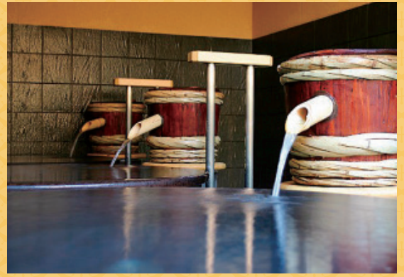
純米酒風呂 老舗「福光屋」の純米酒を贅沢に投入