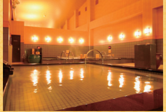
高濃度炭酸泉 血行、新陳代謝の促進、美容効果も期待できます