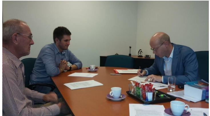
10 juli 2014 oprichting Forest Market Foundation

AWG heeft veel last gehad van geiten waardoor 2000 bomen verloren zijn gegaan. We hadden dit kunnen voorkomen, alleen dat is achteraf praten.