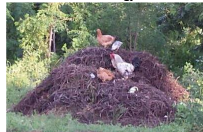
Composthoop met kippen

Het zal jullie niet ontgaan zijn dat ik genomineerd was voor de Simon Jelsma Award. Ik heb mijn netwerk tot vervelens toe gevraagd om mij te steunen door te stemmen. Uiteindelijk werd ik met Africa Wood Grow door de jury gekozen als beste initiatief. Heel veel dank voor al de stemmen 😊