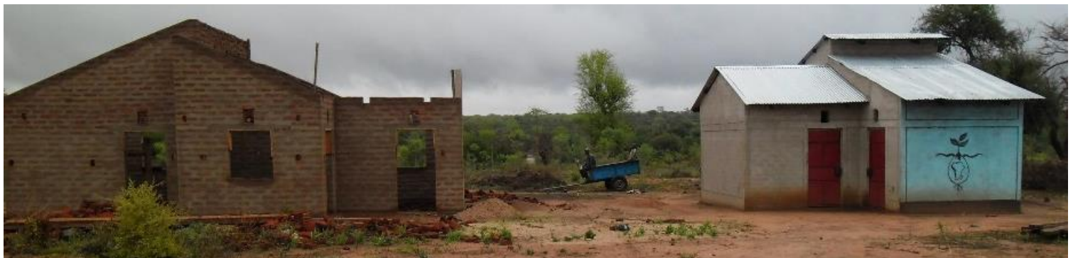
(Het bezoekershuis in aanbouw november 2012)

Lees meer hierover op de website: www.fmf.org