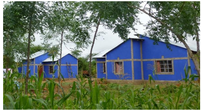
Onze huizen in april 2014

tropische tuin komen met palmen en bloemen. Een tuin waarnaar je met plezier terugkeert na een dag hard werken op het land. De tuin moet de kroon zijn van het werk dat AWG doet zijn, een plek die mensen bij elkaar brengt en met plezier samen