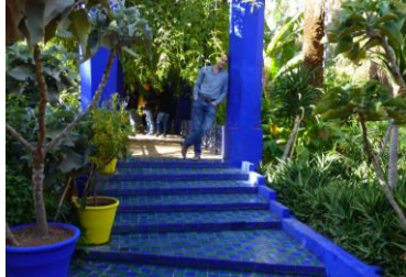
Inspiratie uit Marokko, dec 2013

Deze ontwerper heeft een tropische tuin Jardin Majorelle aangelegd in Marakesh met een schitterend gebouw met een