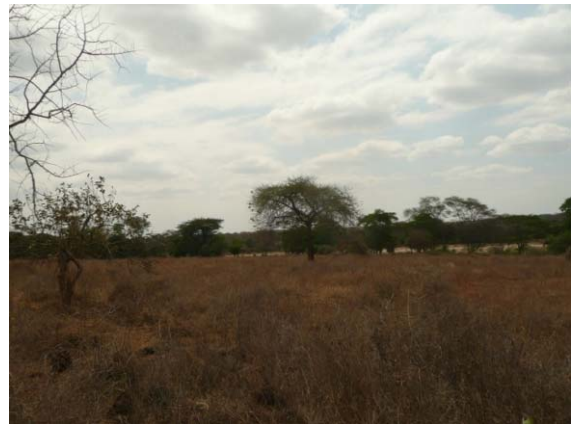
Foto 4 Foto mijn land met daarop in de verte een auto. Dat geeft wel een beetje weer hoe groot het is.

Bij elke persoon die ik tegen ben gekomen ging eerst een uitgebreide kennismaking aan vooraf. Een tijdrovend gebeuren. Uiteindelijk hebben we met een groep van ongeveer 10 mensen heel de grens van het land bewandeld. Waar het niet duidelijk was waar de grens was hebben we uitgebreid gekeken waar die was en dit goed gemarkeerd. Het kwam heel overweldigend op mij over. Het land was groter dan ik had verwacht.