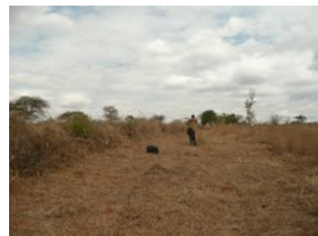
Foto 11 Dit is de grens waar de werknemers als eerst mee begonnen zijn. We hebben opdracht gegeven om een strook van 5 meter naast de grens vrij te maken zodat we makkelijk om het land kunnen lopen. Binnenkort leen ik van een NGO hier in de buurt een GPS zodat ik alle coördinaten van de grenzen kan noteren op een getekende kaart. Deze voeg ik dan bij de verkoopovereenkomst in het dossier. Op deze manier komt er nooit meer een discussie over waar de grens nou eigenlijk ligt. Ik ken de manager goed van die NGO hij helpt mij waar dat kan.

Foto 10 Je ziet de 2 soorten metaal wij gebruiken het sterkste metaal het zelfde als wat voor die plaat staat. Dit metaal gaat makkelijk 40 jaar mee en langer.