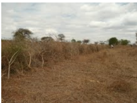
Foto 12 Landgrens met stekeltakkenafzetting