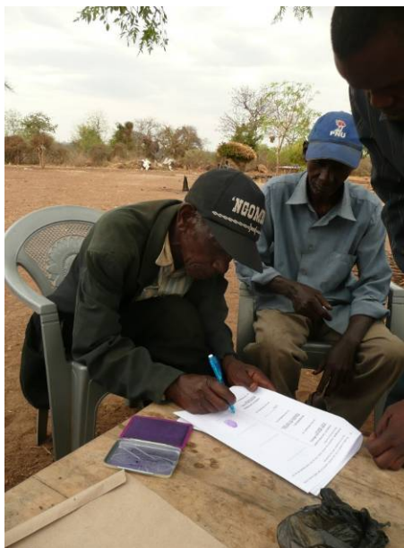
Foto 3 Akkoordverklaring verkoop landeigenaar