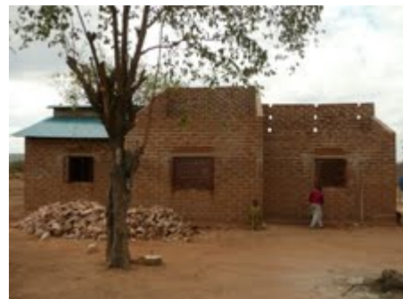
Foto 6 Voorbeeld van hoe de huizen er ongeveer uit komen te zien. Het verschil is dat dit één huis is met 3 met elkaar verbonden kamers. Er is één voordeur. Dit huis laat Daniël voor zichzelf bouwen. In december kunnen Chantal en ik in de linker kamer slapen.