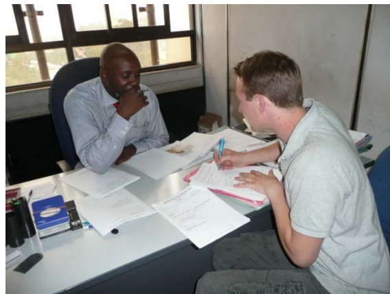
Foto 1 Ondertekening van het opstarten van het bedrijf