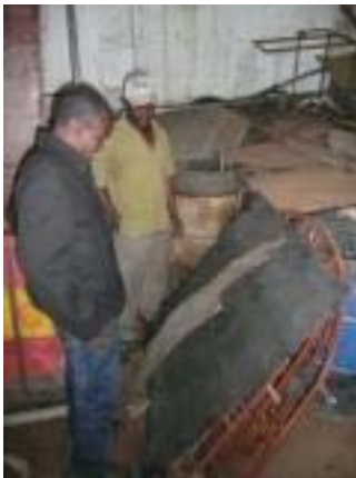
Foto 10 Je ziet de 2 soorten metaal wij gebruiken het sterkste metaal het zelfde als wat voor die plaat staat. Dit metaal gaat makkelijk 40 jaar mee en langer.

Foto 11 Dit is de grens waar de werknemers als eerst mee begonnen zijn. We hebben opdracht gegeven om een strook van 5 meter naast de grens vrij te maken zodat we makkelijk om het land kunnen lopen. Binnenkort leen ik van een NGO hier in de buurt een GPS zodat ik alle coördinaten van de grenzen kan noteren op een getekende kaart. Deze voeg ik dan bij de verkoopovereenkomst in het dossier. Op deze manier komt er nooit meer een discussie over waar de grens nou eigenlijk ligt. Ik ken de manager goed van die NGO hij helpt mij waar dat kan.