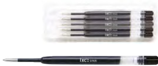
Roller Gel In-In

GEL / CARTUCHOS Y MINAS DE LÁPIZ / CARTOUCHES ET MINES GRAPHITE