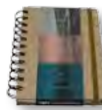
Notebook A6 Cuaderno A6 Cahier A6