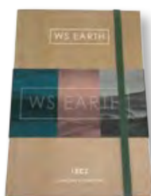
Notebook A5 Libreta A5 Cahier A5