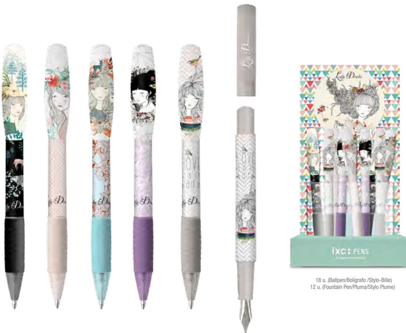
18 u. (Ballpen/Bolígrafo /Stylo-Bille) 12 u. (Fountain Pen/Pluma/Stylo Plume)

FR • Stylo-bille rétractable et stylo plume en plastique, rechargeables. Cinq filles et des textures sophistiquées, créés par l'illustratrice espagnole Vanessa Borrell, qui séduisirent beaucoup de femmes. Recharge stylo-bille: pointe en acier inoxydable et carbure de tungstène bille de 1 mm, avec une longueur d'écriture 4.150 m ± 15%. Stylo plume: plume en acier inoxydable et pointe d'iridium de 1mm, rechargeable avec cartouches de 38 et 72 mm.