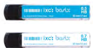
Pencil Leads / Minas / Mines