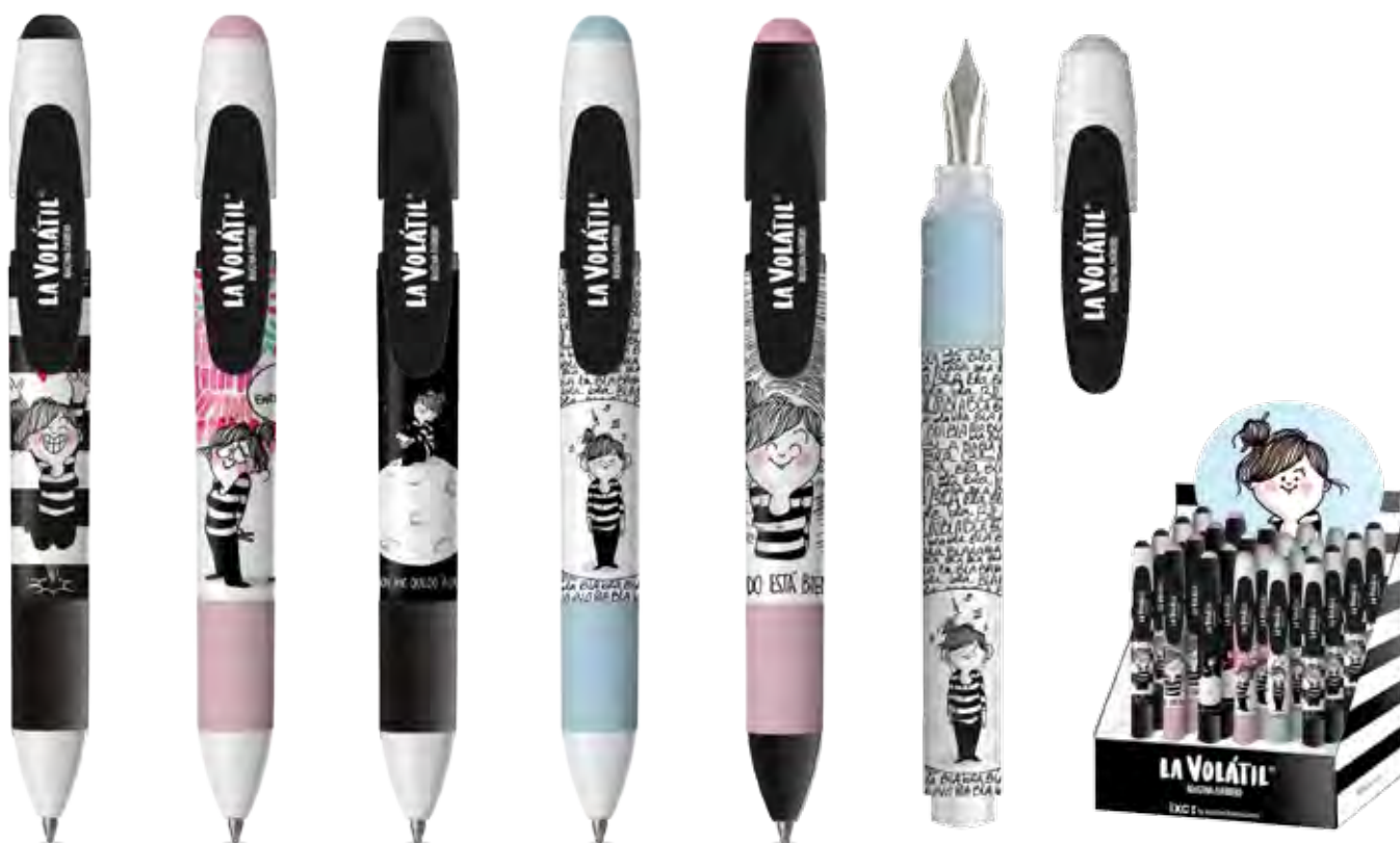
24 u. (Ballpen/Bolígrafo/Stylo-Bille) 12 u. (Fountain pen/Pluma/Stylo-Plume)

FR • Stylo-bille avec bouton poussoir et stylo plume en plastique, rechargeable, avec partie grip douce. Cinq dessins humoristiques créés par l'illustratrice Argentine Agustina Guerrero, qui vous feront penser à des situations quotidiennes à vous. Recharge stylo-bille: pointe en acier inoxydable et carbure de tungstène bille de 1 mm, avec une longueur d'écriture 4.150 m ± 15%. Stylo plume: plume en acier inoxydable et pointe d'iridium de 1mm, rechargeable avec cartouches de 38 et 72 mm.