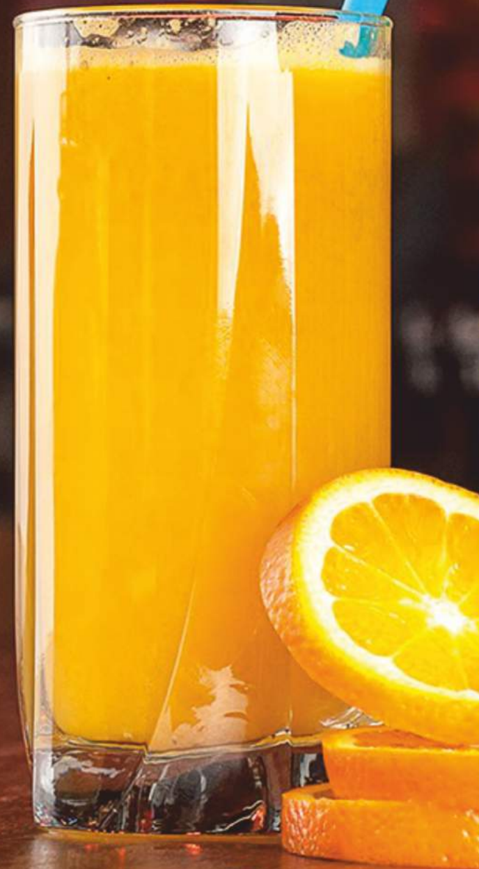
Taze Sıkılmış Portakal Suyu