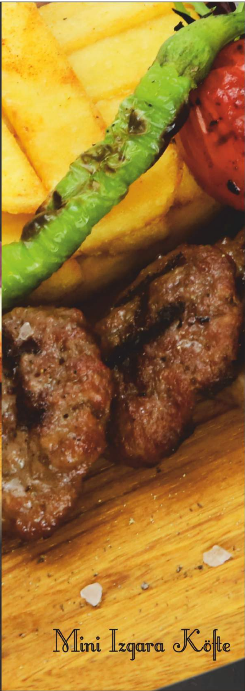
Mini Izgara Köfte