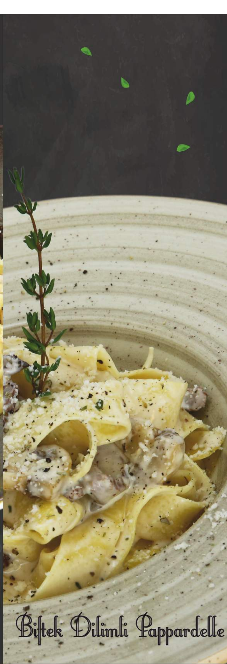
Biftek Dilimli Pappardelle