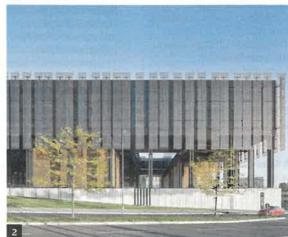
1 - La Cour de justice de l'Union européenne est implantée depuis 1973 sur plateau de Kirchberg, à Luxembourg. Elle s'étend aujourd'hui sur 250 000 m 2 .