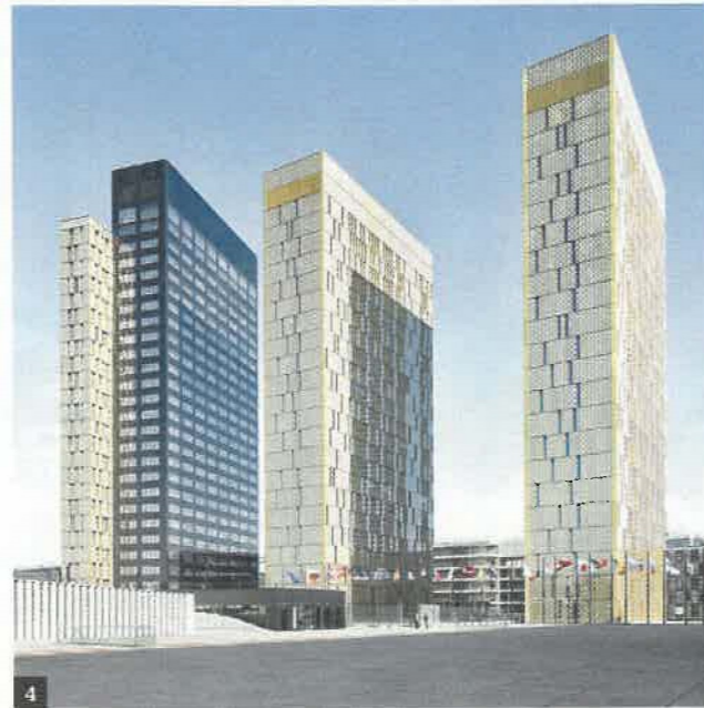
4 - Trois tours dominent le site: les deux dorées (à droite) ont été livrées en 2008; la noire et or en 2019.

Aujourd'hui, la CJUE s'étend sur 250 000 m 2 . Y travaillent quotidiennement 74 juges, 11 avocats généraux, deux greffiers et 2 217 employés. « Tous ont conscience de là où ils évoluent, car ici, l'architecture fait l'institution », estime Jean-Michel Rachet, chef de cabinet du greffier de la Cour de justice. De son côté, Dominique Perrault explique avoir « cherché à gommer le temps pour mettre en place une Cour de justice intemporelle ». Un jardin parachèvera l'ouvrage en 2020. ● Milena Chessa