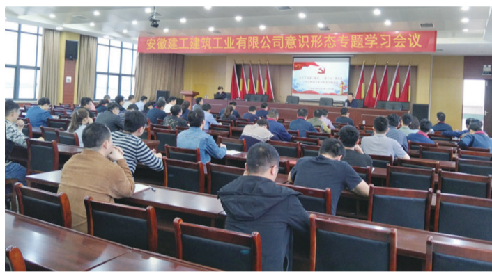
建筑工业公司党支部召开意识形态工作专题会