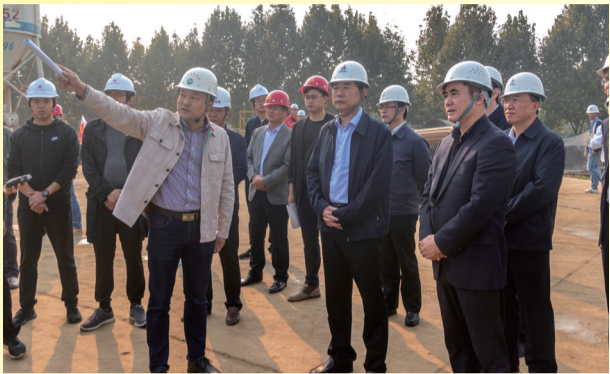
1、2018年10月17日,省委常委、常务副省长邓向阳调研安徽三建承建的安徽创新馆建设情况。

在各级领导关注的目光中,安徽三建项目职工坚定信心决心,鼓足干劲,克服了冬季施工、两节劳动力缺乏,施工难度大,工期超级紧张等困难,日夜奋战,终于刷新“三建速度”,仅用短短5个多月时间,全面优质完成安徽创新馆的建设任务,为安徽创新发展贡献三建力量!