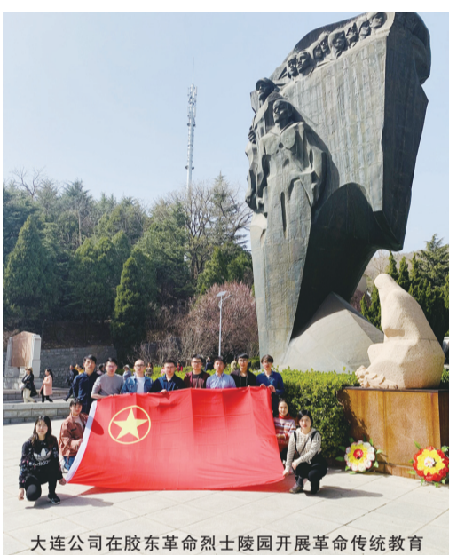
大连公司在胶东革命烈士陵园开展革命传统教育

为进一步弘扬中华优秀传统文化,培育和践行社会主义核心价值观,加强爱国主义精神和理想信念教育,清明节前后,安徽三建建筑工业公司、大连公司、装饰公司、西北公司等所属单位纷纷通过主题党日、团日等党建团建活动组织广大党员职工开展革命传统教育,祭奠革命英烈、传承革命精神。