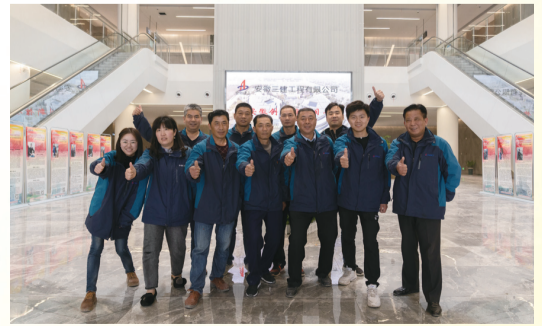
安徽创新馆土建团队:我们奋力拼搏,冲锋在前,为按时交付奠定坚实基础