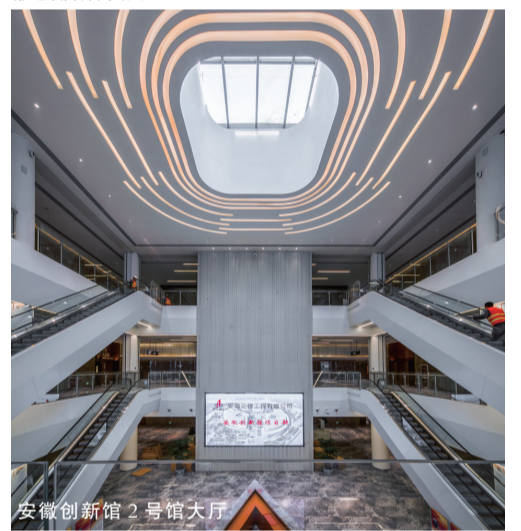
安徽创新馆2号馆大厅

知难不惧,迎难而上,是安徽三建的传统。公司主要领导立即到现场召开动员会,分析形势、调集资源、快速启动项目。在不到三天的时间里,公司抽调精兵强将组建了一支技术精良、作风过硬的50多人项目管理团队;调集了800多人的专业劳务队伍;投入设备40多台、准备资金2000多万元,集中“火力”抢攻安徽创新馆项目。