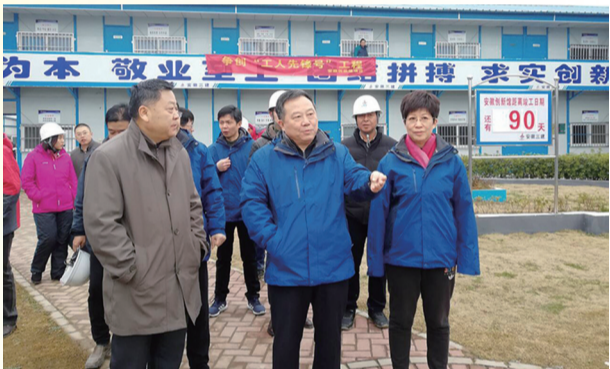
3、2019年元月1日,新年第一天,上午10点,安徽省委常委、合肥市市委书记宋国权、市长凌云等有关领导一行到安徽创新馆调研慰问一线职工。