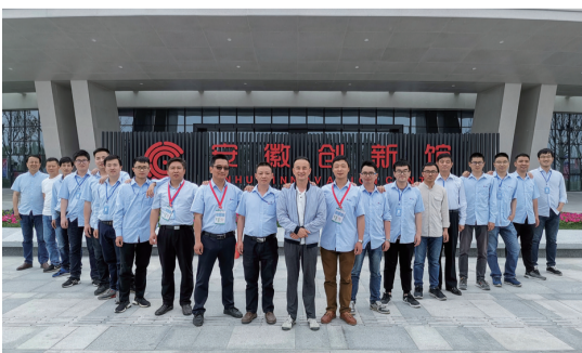
安徽创新馆安装团队:我们顽强拼搏,采用BIM等先进技术,5个月完成1.6亿产值