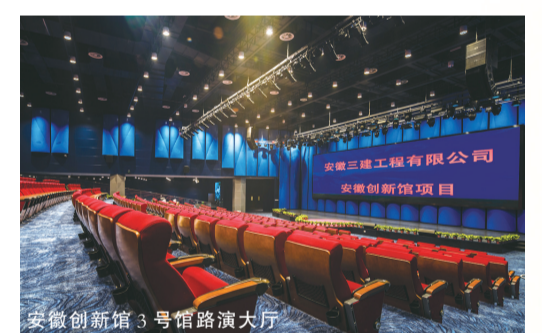
安徽创新馆3号馆路演大厅

建设安徽创新馆项目就像是一次大考,安徽三建人不畏艰难,全力以赴,终于交上了一份令人满意的答卷。(汪利民 戴恒晖)