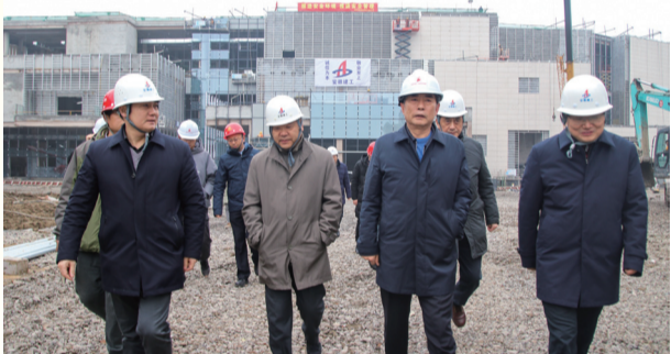
4、2019年元月6日下午,省委常委、常务副省长邓向阳到安徽创新馆项目实地调研,部署安徽创新馆开馆筹备工作。