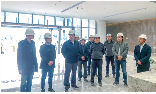
6、2019年3月29日下午,合肥市副市长宁波一行到安徽创新馆项目调研指导工作,合肥市政府副秘书长、办公厅主任王道荣、重点局局长沈龙泉以各施工单位现场负责人陪同。