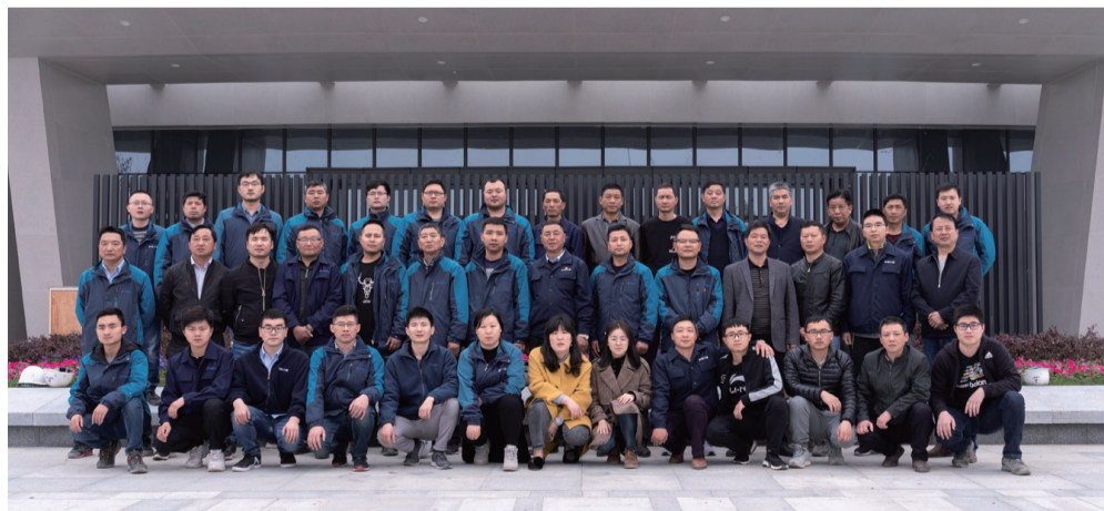
安徽创新馆项目大家庭:我们刷新“三建速度”

安徽创新馆开馆啦!当无数期待的目光聚焦在美丽的安徽创新馆上的时候,让我们一起来认识一下安徽三建安徽创新馆项目团队!回顾那艰苦而又激情澎湃的奋战高光时刻!去了解创造了“三建新速度”、打造精品安徽创新馆的三建人!