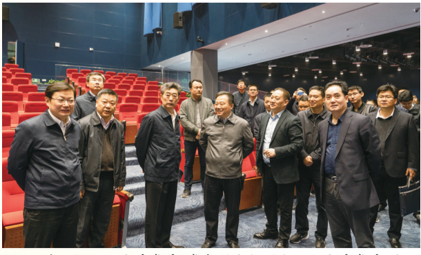
7、2019年4月13日,省委常委、常务副省长邓向阳和省委常委、合肥市委书记宋国权到安徽创新馆调研。因为领导们在三号馆全球路演大厅视察。

为确保安徽创新馆如期开馆,承建单位安徽三建凭借强大的专业能力、打破常规的施工组织方式和无障碍的内部协调,交出了一份令人满意的答案。