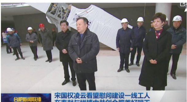
5、大年三十,安徽省委常委、合肥市委书记宋国权、市长凌云看望慰问安徽创新馆依然坚守在岗位上的一线职工。