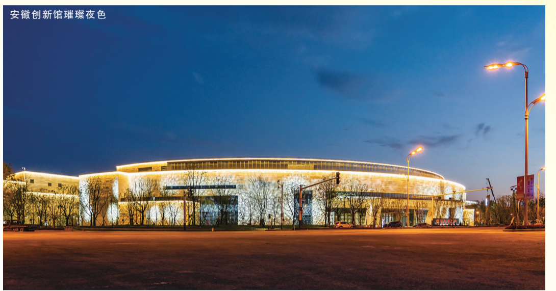
安徽创新馆璀璨夜色

工图,为节约时间,他们根据效果图和类似工程编制出模拟施工计划,明确关键节点和工程重难点,摸排供应商、分包队伍和劳务班组。考虑冬季施工和赶上春节放假,项目部提前备足砂石、水泥、板材、地砖等材料,组织电梯、空调机组等设备提前进场。