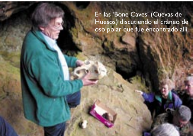
En las 'Bone Caves' (Cuevas de Huesos) discutiendo el cráneo de oso polar que fue encontrado allí.

From 'A Man in Assynt' by Norman MacCaig, 1969