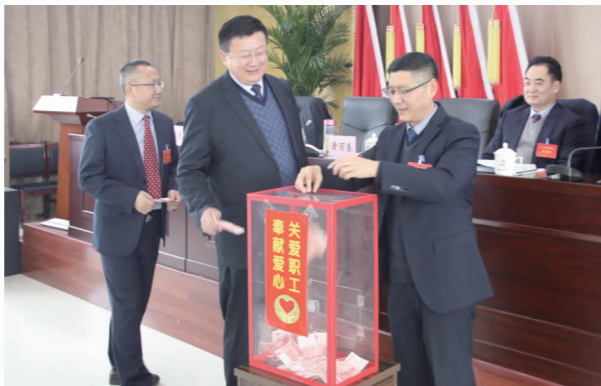
向公司困难职工帮扶基金捐款