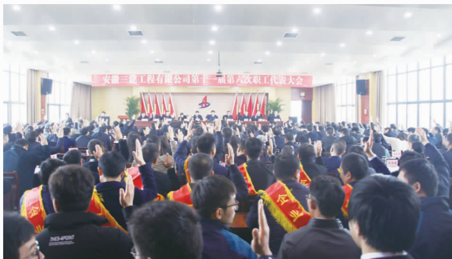
职工代表表决通过《经理工作报告》