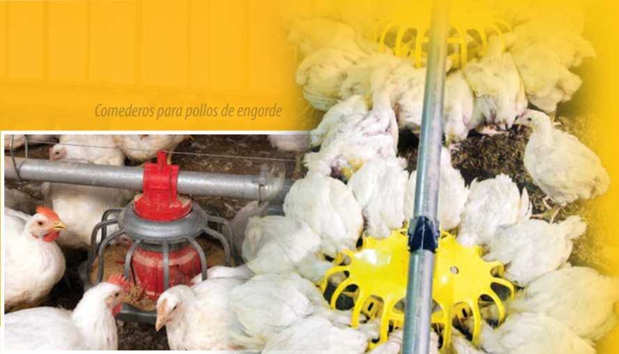
Comedores para pollos de engorde

Elaboración del producto final – carne aviar