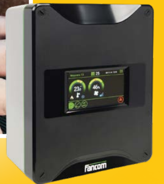
Controlador electrónico para galpones de cerdos