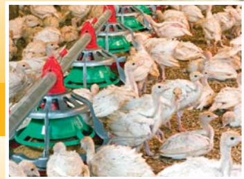
Comedores para pavitos