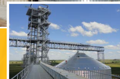
Estructuras para silos

Elaboración del producto final – alimentos balanceados, alimentos para consumo humano, biocombustibles