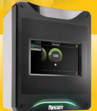
Controlador electrónico para galpones avícolas