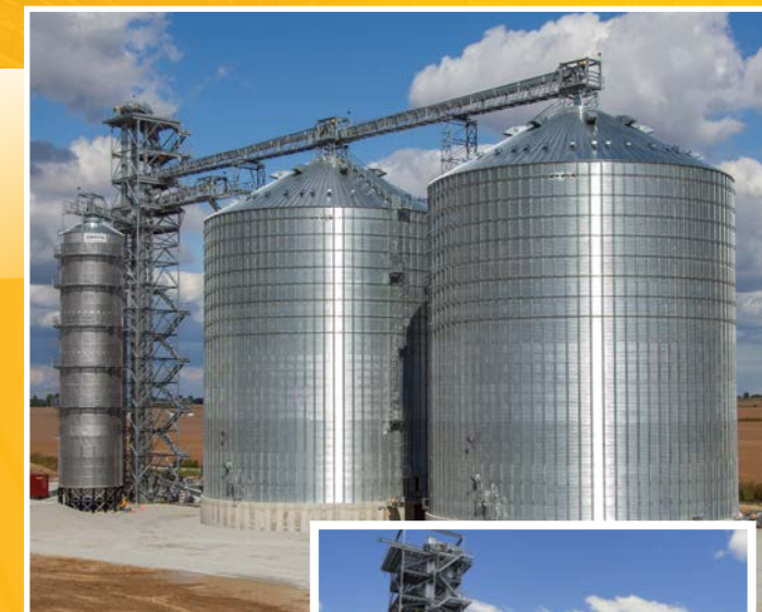
Silo comercial para granos

Almacenamiento, manejo, acondicionamiento y estructuras