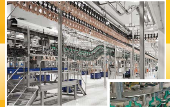
Sistema de procesamiento de carne aviar