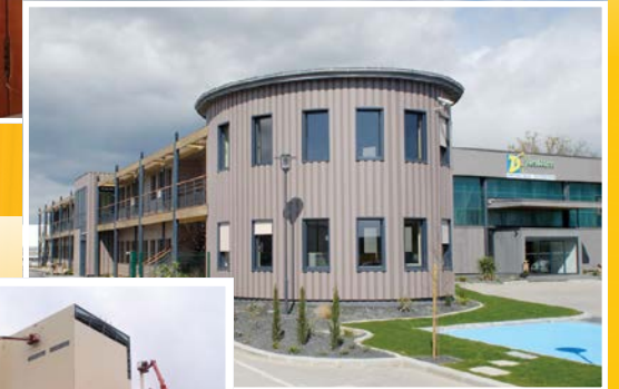
Edificios de oficinas

Caballerizas y comederos para equinos; ventanas y puertas arquitectónicas