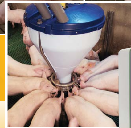
Alimentación de lechones