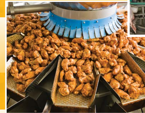
Clasificación y pesaje de pollos