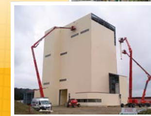
Edificios de almacenes

Sistemas de contención de aceite; almacenamiento y manejo de pelets de plástico