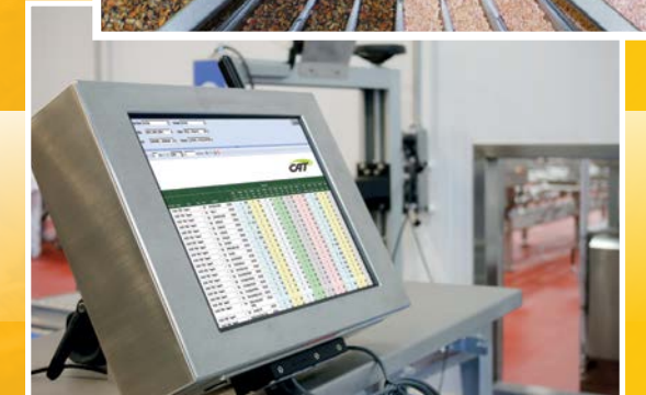
Software para procesamiento de alimentos