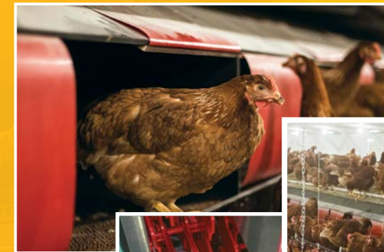
Nidos para ponedoras