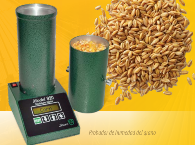
Probador de humedad del grano