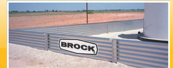
Sistema de contención de aceite

Sistemas de contención de aceite; almacenamiento y manejo de pelets de plástico