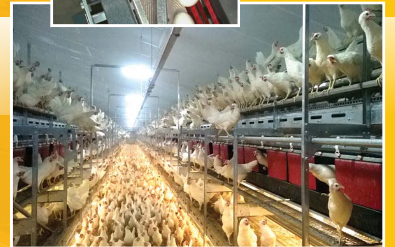
Sistemas aviarios para ponedoras