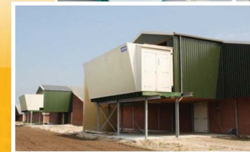
Sistemas de limpieza y filtrado de aire