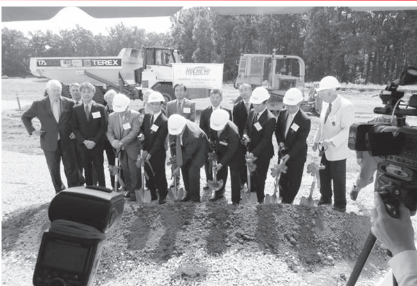
8万平方メートルの工場用地の1/3を利用して工場を建設予定

ノースカロライナ州メイソン市に森永アメリカファーズ・インクの工場を新設するにあたり、6月5日に地鎮祭が行われた。同工場では『ハイチュウ』の生産を開始し、順次生産品目を拡大していく予定。16年3月期には13年3月期の5倍の50億円の上高を目指す。地鎮祭では、須永総