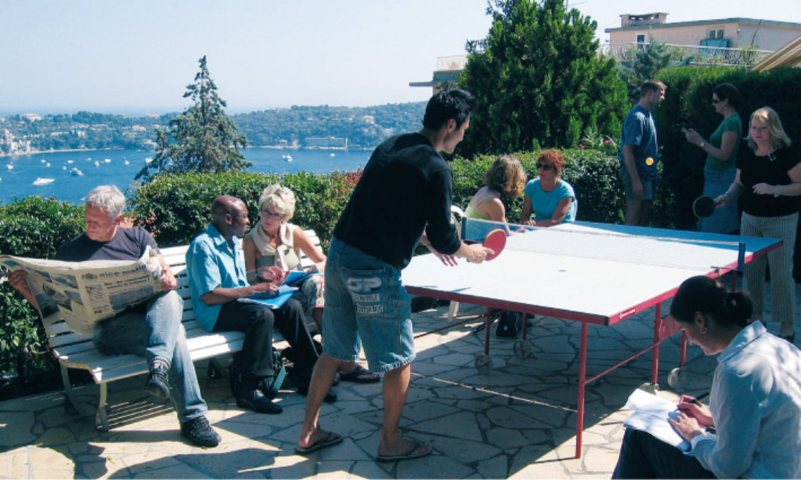
Entspannung während einer Pause