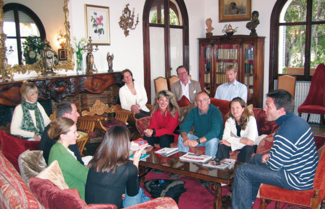
Gruppendiskussion im Aufenthaltstraum