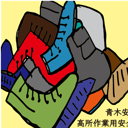
青木安全靴 高所作業用安全靴カタログ